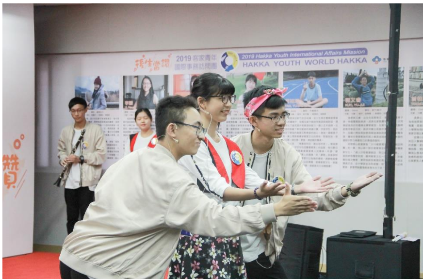
（我的客語主持初體驗。圖片取自 2019 客家青年國際事務訪問團）

授旗典禮上那份驕傲與感動充滿心頭，擔任授旗代表的我從主委手上接下旗幟，揮舞的旗幟如同內心雀躍的心情般，經過兩星期課程洗禮後，每個人都承載著熱情與活力，準備好要展開這趟旅程了！