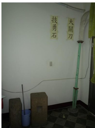
圖 2 李屋个鎮家之寶：120 斤大關刀、兩粒武石（拍攝日期：2018.05.09）