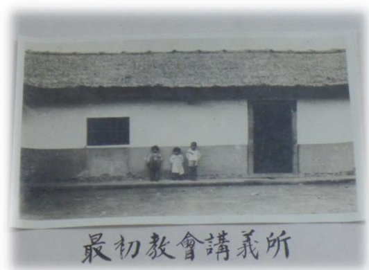
翻拍自教會牆上照片