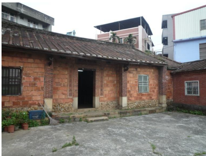
圖 3 武營街个百年李家老屋（拍攝日期：2018.05.09）