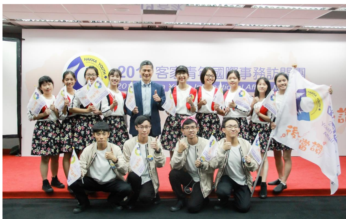
（授旗典禮上李永得主委給與客家後生們滿滿的祝福。