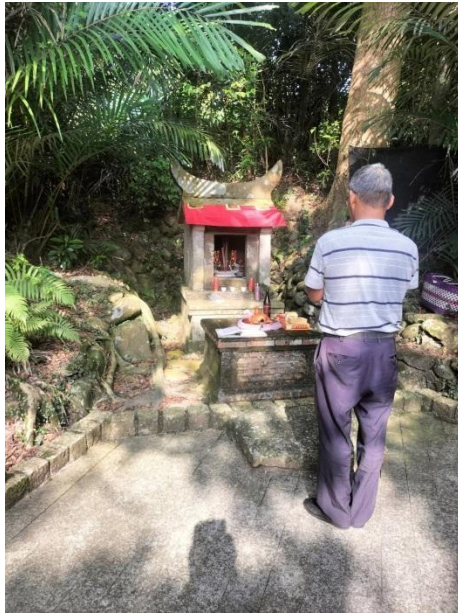
圖5 值年爐主帶幾儕仔代表莊民虔誠敬拜，照名冊摺伯公講參加个名姓。

大約在十過年前，大北坑推動社區營造，想愛打造五大園區，尋出大北坑特殊个人文特色，放入客家元素，筆者在本刊462期（2025.02.15）也識報導過，伯公文化園區就係其中之一。申請經費補助，拓寬道路，在路壁鑲刻大北坑伯公簡介、春耕、夏耘、秋收、冬藏四季伯公福个說明。(圖6、7)大北坑保留恁特殊个文化特色，希望做得永久流傳下去。