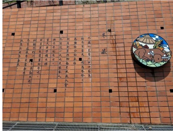
圖7 四季伯公福照春耕、夏耘、秋收、冬藏說明，這係「冬藏」 (2024.08.27攝)