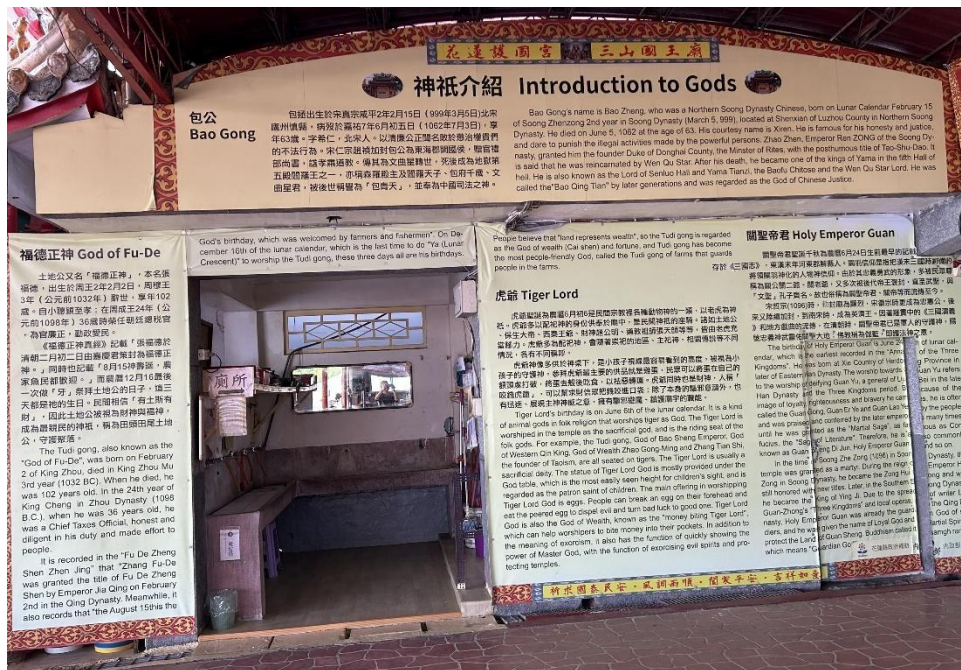
花蓮市護國宮中英文神祇介紹