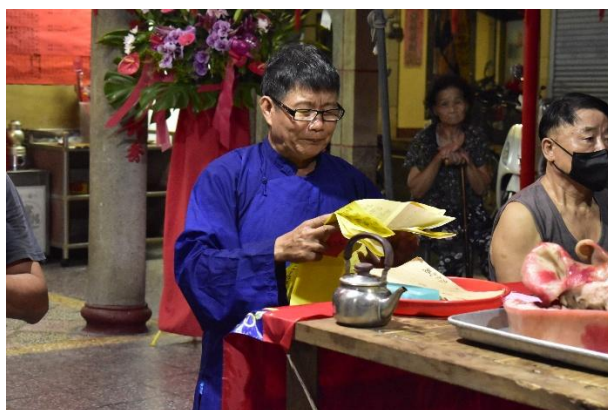
先生做三獻禮時宣讀表文 ( 拍攝於溪埔寮水德壇 113.07.23 )