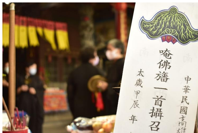
幡旗也係福佬人講个【魂幡】( 拍攝於南山宮 113.08.07 )

以上就係佢等美濃个渡孤儀式，雖然佢毋係專門在研究渡孤个人，但係佢希望在這用佢看著摺聽著个習俗，同大家分享佢等美濃个渡孤，也歡迎大家有閒來美濃寮！