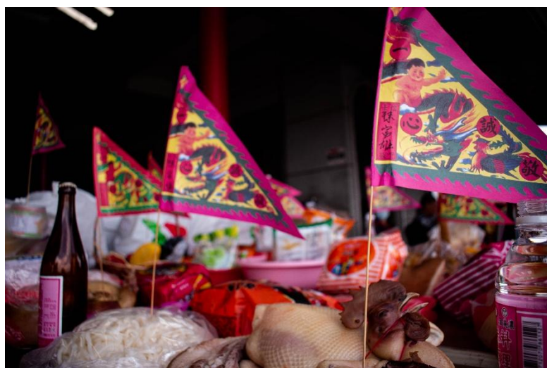
自家牲儀來渡孤个數量越來越少 ( 拍攝於南山宮 113.08.07 )

公普同私普，佢想渡孤這個詞，應該就係講普渡孤魂抑係超渡孤魂个意思。在美濃地區个敬外項習俗較無流行，單淨少數人會在禾埕項準備牲儀敬好兄弟，大部分人家顛倒會配合村莊廟項渡孤个時間，來準備牲儀贊普，但係這下个社會大部分人家在外面食頭路，歸少有間參加廟項个活動，也變成廟項有代辦普品个贊普方式，乜伸著少數个老人家會像頭擺樣，準備牲儀來渡孤。