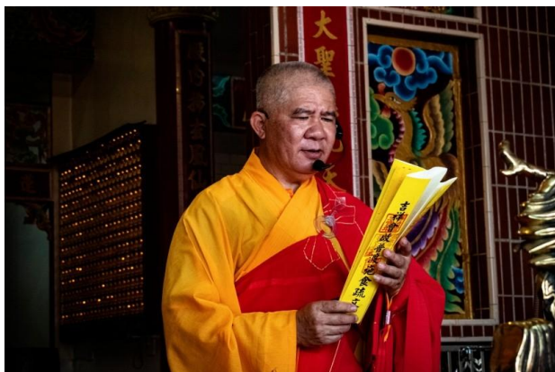
經懺師宣讀渡孤疏文 ( 拍攝於九穴慈靈宮 113.08.23 )