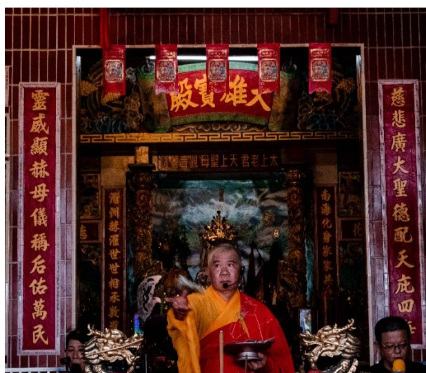
經懺師將供品拋出象徵施食 ( 拍攝於九穴慈靈宮 113.08.23 )