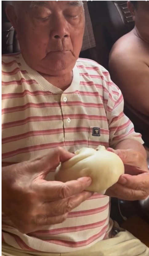
阿爸擘開燒燒個包仔