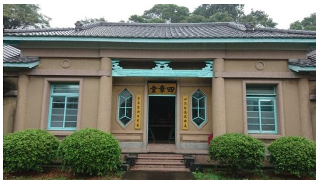
圖 2 84 年完成个傳屋四章堂「日本近代和風」建築樣貌（2023.12.06 攝）

這棟屋盡大个特點就係：改建過後，無用原來个伙房屋建築方式，材料也無用泥磚、紅瓦，係用紅毛泥「鐵筋康庫力」（鋼筋混凝土）淋个，歇山式个屋頂，青色个日本文化瓦，洗石仔个外牆，做得講係「日本近代和風」建築。毋過目前龍片還有保存兩間个橫屋，係當年伙房屋个樣仔，屋肚還保有一條「牛嫲樑」，聽講做得承樑、承重、防震个作用。（圖 3）