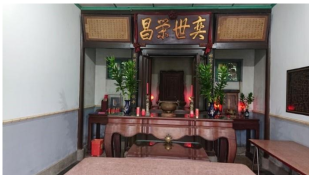
圖 4 祖宗牌位前个廳對、牌位頂高个（龍片）耕田訓子歌、 （虎片）讀書訓子歌（2023.12.06 攝）