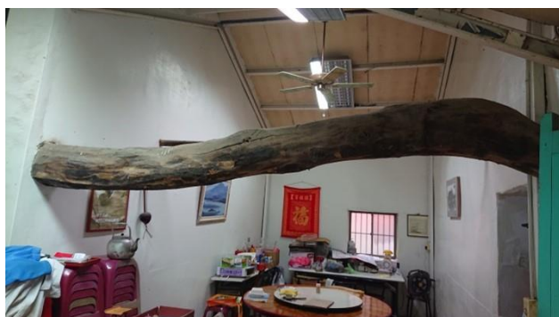
圖 3 牛嫲樑（2023.12.06 攝）

這棟屋盡大个特點就係：改建過後，無用原來个伙房屋建築方式，材料也無用泥磚、紅瓦，係用紅毛泥「鐵筋康庫力」（鋼筋混凝土）淋个，歇山式个屋頂，青色个日本文化瓦，洗石仔个外牆，做得講係「日本近代和風」建築。毋過目前龍片還有保存兩間个橫屋，係當年伙房屋个樣仔，屋肚還保有一條「牛嫲樑」，聽講做得承樑、承重、防震个作用。（圖 3）