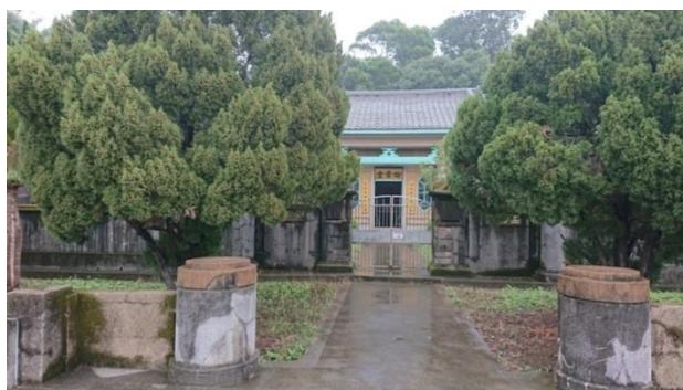
圖 1 地址位在楊梅區秀才路 289 巷 26 號个傅屋「四章堂」（2023. 12. 06 攝）

傅屋个堂號大部分安到「清河堂」，也有安到「版築堂」，毋過楊梅秀才窩太平山下這間傅屋安到「四章堂」，仰會同人無共樣呢？（圖 1）