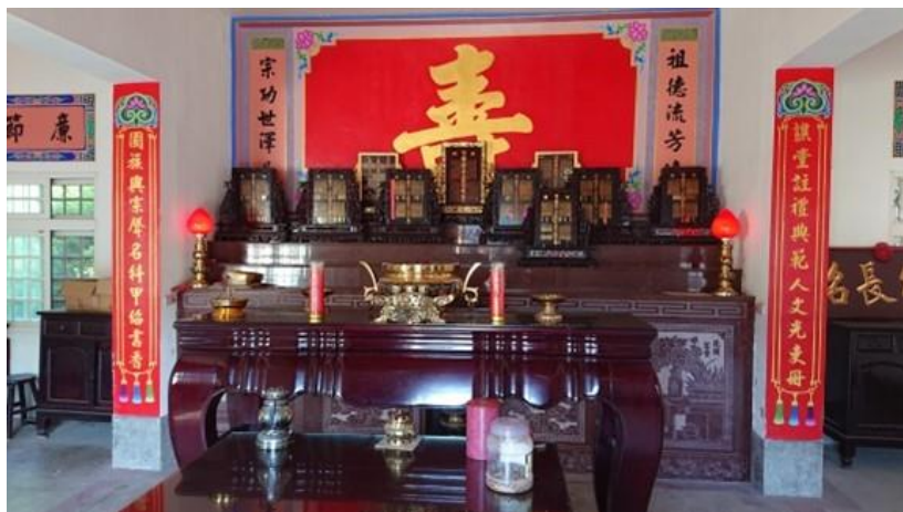
圖 6 現下平鎮區新榮路 213 號戴屋公廳祖先牌位安放情形 (2023.11.07 攝)