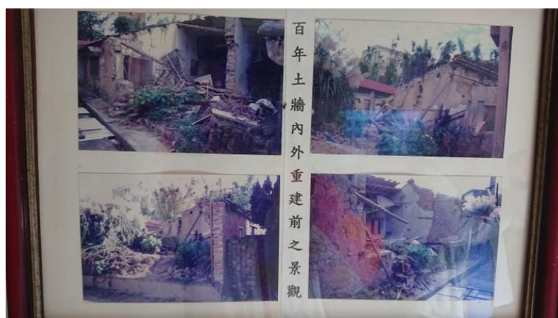
圖 4 公廳新起之前个泥磚屋塌角陋少情形 （2023. 11. 07 翻拍自虎片橫屋个壁項）