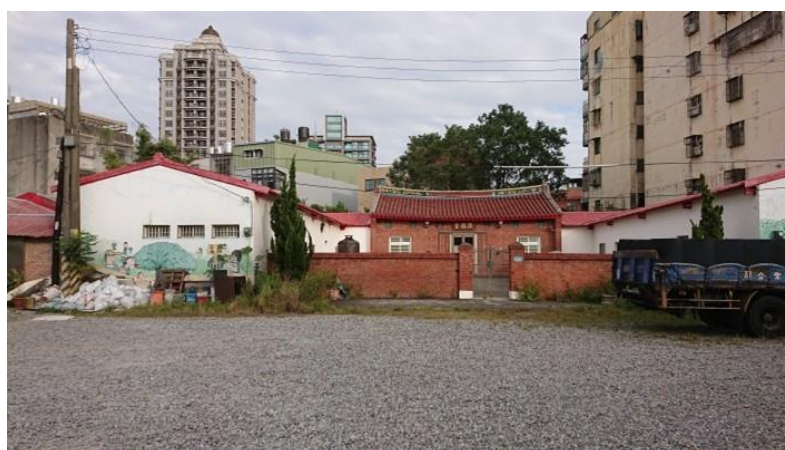
圖 5 戴屋公廳現下樣貌，樸實無當華麗。（2023. 11. 07 攝）

原來在新勢公園个總公廳「下屋公廳」，為着配合都市計劃，徙到內壠福特（Ford）汽車修理廠層四房分着个地項，先搭鐵皮屋暫放祖先牌位。過無幾年，子孫又有議論，提出意見，背尾在阿公婆面前跌筊仔，得着兩片个「聖筊」