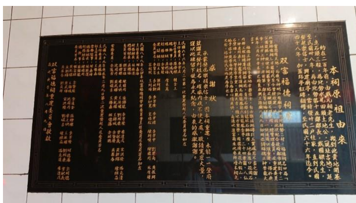
圖 3 「雙富福德祠」裡背个石碑刻等「北勢水尾田頭伯公」个由來同改建經過。(2024. 05. 04 攝)