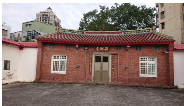
圖 1 戴屋公廳「譙國堂」(2023. 11. 07 攝)