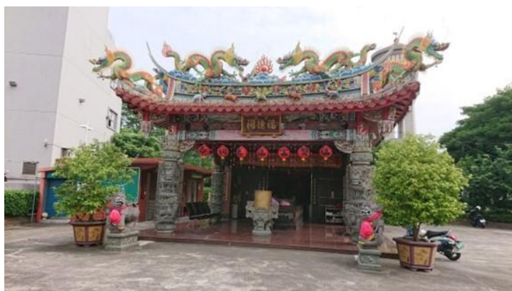
圖 2 新勢國小前、延平路脣个「雙富福德祠」(2024. 05. 04 攝)

拜，嘎變到庄頭伯公。後來土地重劃，這一大搭地變到公園用地，正徙到這下新勢國小對面，延平路脣个位所，安到「雙富福德祠」。(圖 2、3)