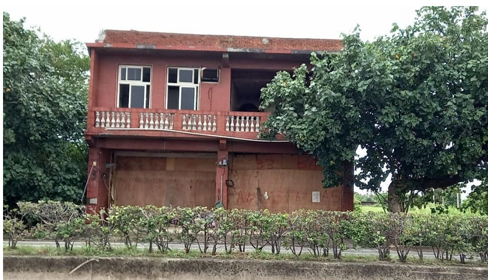
(圖 1：人去樓空的屋，大門用木板封鎖。)