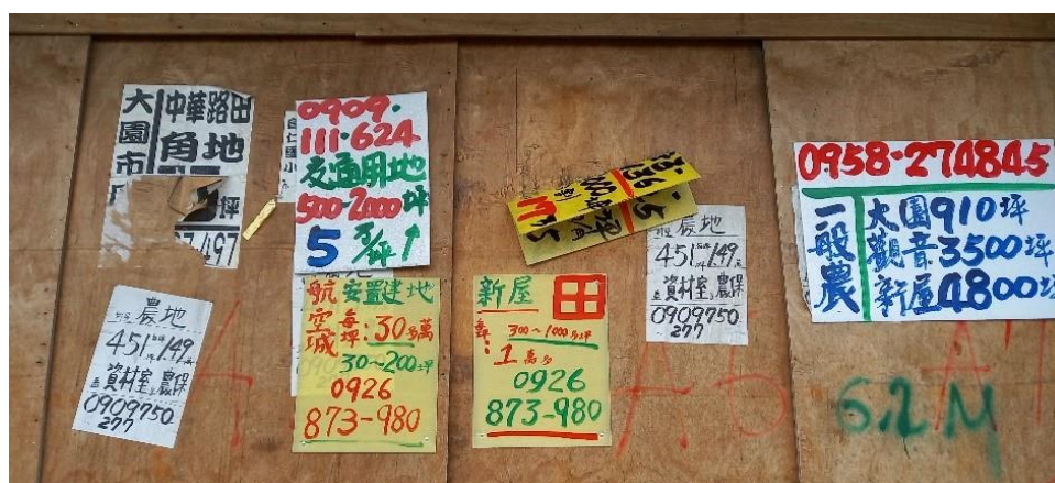
(圖 2：封住的木板上，貼滿房屋廣告。)