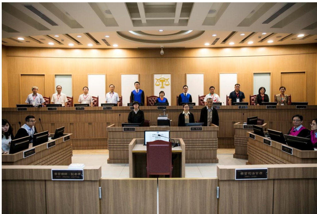
新竹地方法院國民法官模擬庭。

司法院目前正推動「國民參審制度」，俗稱國民法官制度。《報導者》記者實地觀摩新竹、台南地院的國民參審模擬法庭，也透過多位實際參與者的經驗，爬梳未來的法院風景。