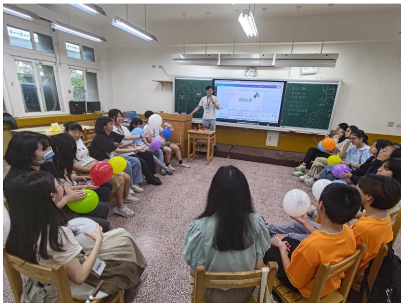
在營期最後一天舉辦的歡送會