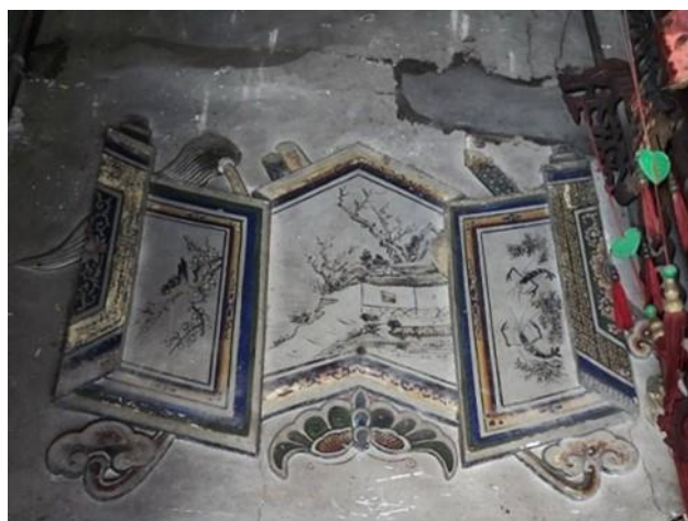
圖 23 虎片子孫廊門楣頂背个「摺頁」

卷軸、摺頁表示「開卷有益」、「科考得名」；寶劍練武，強身保國，這就係「文武雙全」。靈芝生到清幽靜雅个山頂，蓮花生到厝糟个所在毋會受着污染，故所「靈芝、蓮花」个含意就係幽靜、清淨同高潔。「仙掃仔」係仙人个法器寶物，抑係有壅塵就愛用佢撥淨來。「揚蝶仔」華語講「蝴蝶」，「蝴蝶」个「蝴」華語同「福」共音，意思係「福到眼前」。大門內个頂背寫等「福星拱照」，表示子孫同人客出門都有福星照護，這係每一個客家伙房屋都有个彩繪文字。(圖 24)