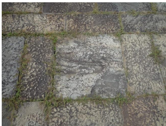
圖 14 天時坪所鋪个石頭，係大陸運過來个「壓艙石」，中央係拜天公个位所。(2016.06.25 攝)

櫃臺腳、屋面前天時坪鋪个石頭，全部都係大陸運過來个「壓艙石」，安到「閘(ngad)艙石」。(圖 14)歸棟屋包含正身同橫屋，全部都係用日本時代，當時台北「台灣株式會社」在基隆河壩脣起窯生產最好个「TR 磚」，紅磚仔結个。這 TR 磚一出窯賣个時節，一坵磚仔包一張糯米紙，非常貴，用牛車轉運，從臺北運來。圍牆，也就係「文筆牆」，牆腳係用花崗石做底，磚仔係用油面、顏只、中興三種磚仔合紅泥結起來个。橫屋門框个磚仔，有烏个、紅个雜等，係較硬个火頭磚，安到「煙燻磚」，係楊梅在地做个。因為該兩時楊梅有當多磚窯，本地个泥係紅个，這紅泥係燒磚瓦當好个材料。結「煙燻磚」愛有一息仔技巧，正會有烏个斜紋，到這下來這兜磚仔全部嘎變到特色。