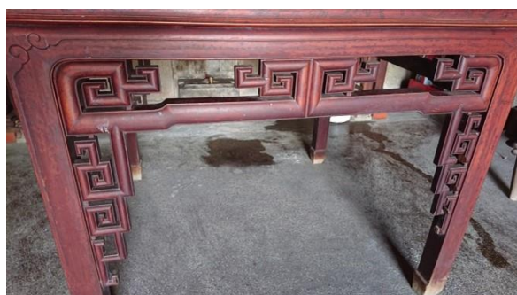
圖 18 拜桌 (供桌) 个硬團木雕。(2023. 08. 21 攝)

兩片壁項掛等玻璃彩畫藝術，虎片有一面鏡仔(圖 19、20)。這位本旦係放一隻大時鐘，後來壞忒正放鏡仔。做麼个會放時鐘仔抑係鏡仔呢？聽主人講：「頭擺祖公有做過貢生，政府長透會派人來，『鐘』就係『忠』。換擺『鏡仔』，用華語講『鏡鐘』就係『盡忠』，分落來个人，看這面鏡仔，就會認定這家人有『盡忠』！」在這玻璃彩畫下背壁項，貼磚四角有磚刻「蝠婆仔」，華語講「蝙蝠」，表示「四季賜福」，連落屋个貴賓，就係「五福臨門」也！（圖 21）