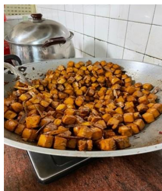
攝於新竹縣新埔鎮早坑里老家

世上麼个花最靚？係人心肝肚醜醜个愛心花一等靚，從細就看着阿爸、阿姆常透去膠村肚做好壞事个家庭才搵手，平時阿爸、阿姆熱心助人，所以爺衰過身該下當多親戚朋友鄰舍自動來屋下搵手，搭布棚、煮食、做老人衫，送老人家出山等等，實在分佢當感動，人講：送人鮮花手留香，分人好話心留甜，佢愛講啊：膠人搵手心燒暖哦。