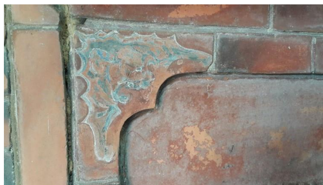
圖 21 廳下屋壁个磚刻「蝠婆仔」， 意涵「四季賜福」、「五福臨門」(2016.06.25 攝)

祖公起屋之時就希望屋仔清淨高雅、子孫道德高超、文武雙全，故所在「子孫廊」(內通廊巷路)左右門項各寫「左宜」、「右有」，係取詩經小雅篇「左之左之，君子宜之；右之右之，君子有之」个詩句仔，希望屋下人、子孫个品格、道德都愛比人多加雙倍。子孫廊門楣頂高，龍片有「卷軸」、書涵、兩枝筆，