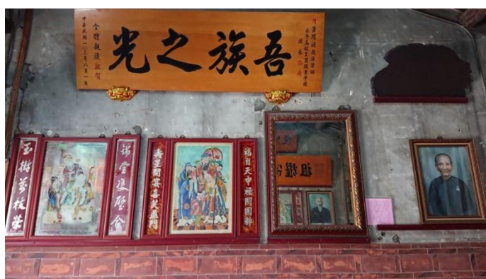
圖 20 虎片玻璃彩繪、文字藝術、鏡仔。(2023.08.21 攝)