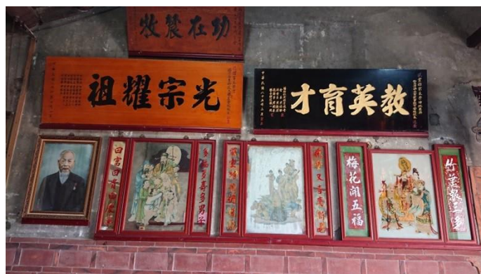
圖 19 龍片玻璃彩繪、文字藝術 (2023.08.21 攝)