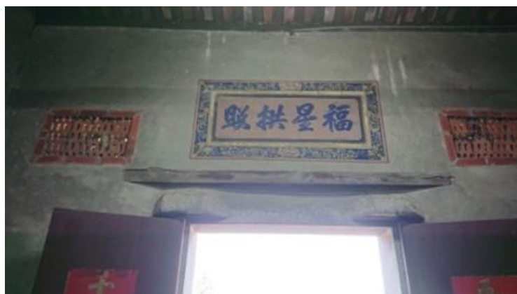
圖 24 出門有「福星高照」彩繪文字。(2020.10.28 攝影)