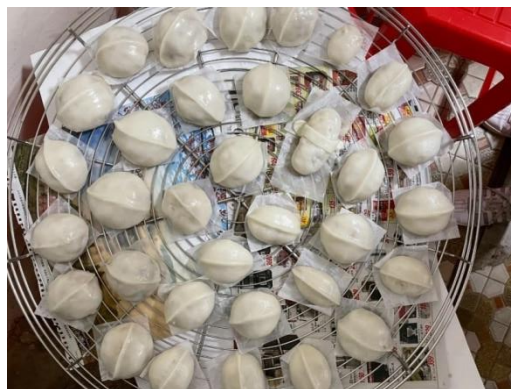
攝於新竹縣新埔鎮早坑里老屋

過年過節，菜包是最常做的客家版，菜包裏有蘿蔔絲、蝦米、肉絲等，我們孩子們都會搶著幫忙包，有時會自創不同形狀，非常有趣。