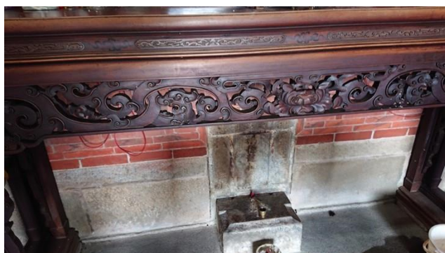
圖 17 神桌个軟團木雕、祖先神龕下个龍神神位。(2023. 08. 21 攝)

本屋个樹材全係大陸運來个福州杉，做棟梁、桁桷、簷樑這兜。大門入來頂高有一枝樑，安到「狀元樑」，吊等廳燈，係有擱大肚个婦人家落來，會摻煞氣擋忒，毋會一下就看到棟梁頂高个八卦。木雕有神桌个圓形「軟團」(圖 17)，拜桌方正个「硬團」(圖 18)，還過棟梁兩片个「雀替」。