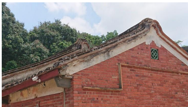
圖 15 橫屋外牆、棟頭形式、鳥踏（2023.08.21 攝）