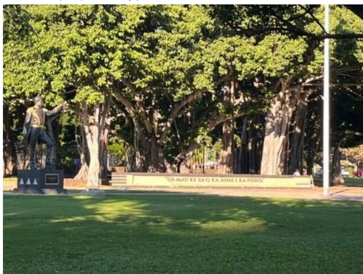
Ua Mau ke Ea o ka 'Āina i ka Pono

本文作者於今 (2023) 年 1 月初前往夏威夷大學，發表英文論文，在研討會的空餘時間，走訪州議會、州政府等政府機關。在該州自來水部門 (board of water supply) 門前見到「Uwē ka lani, Ola ka honua」夏威夷語的諺語，意思是：雨水的滋潤讓大地恢復生機 (When the heavens weep, the earth lives)。也在 Thomas Square 見到「Ua Mau ke Ea o ka 'Āina i ka Pono」夏威夷語的諺語，意思是：正義永存 (The life of the land is perpetuated in righteousness)。在踏查過程中，看見許多政府機關門口標誌使用「Aloha」夏威夷語，對於少數族群語言廣泛出現在公共空間，處處存著豐富的夏威夷語的語言景觀，深感震撼。