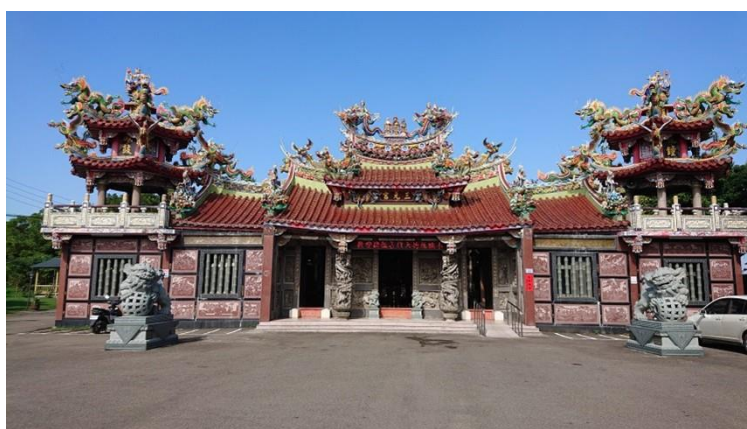
圖 1 楊梅三湖三元宮現貌（2018.11.29 攝）

楊梅三湖三元宮（圖 1）位在楊梅區三湖里楊湖路三段 600 號，主神三官大帝，係楊梅西區居民个信仰中心，也係客人當普遍个信仰，祭祀圈包括楊梅西片析个長岡嶺同伯公岡（今富岡）兩大地區。