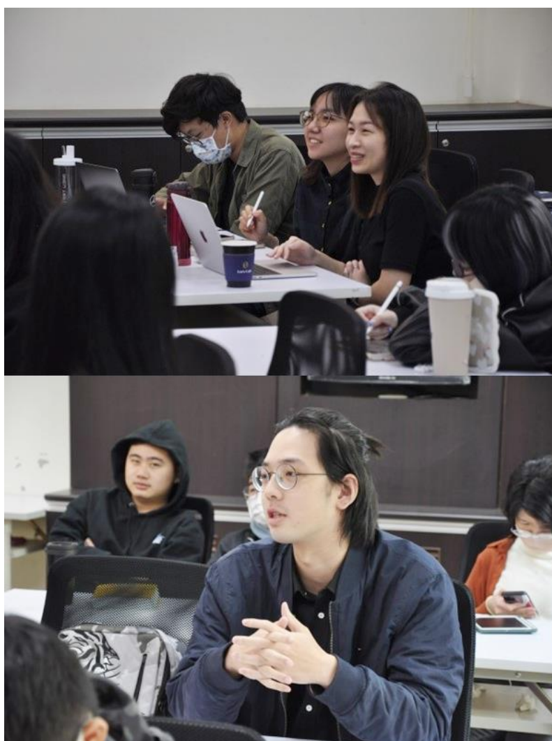
同學們針對演講主題提問

一個新竹，兩個世界，一邊是不斷增設學校以舒緩就學需求，卻仍有家長無法將孩子送進家對面的國中小學，一邊是努力招生仍敵不過人口外流的衝擊，新生數也逐年減少，甚至創校近一世紀首見 0 入學。0 不只是個數目，更象徵越來越少人在客庄長大，後代和客庄文化的連結也只會愈發薄弱。