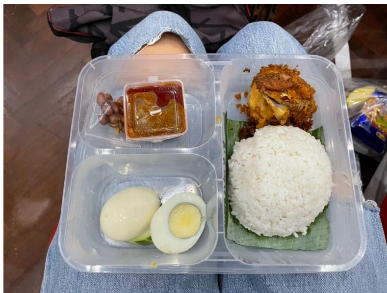
圖 2 活動提供的便當為 Nasi Lemak ( 椰漿飯 )，馬來西亞的招牌美食！

從〈110 年度世界各主要國家之我國留學生人數統計〉資料來看，到馬來西亞留學的臺灣學生數共有 470 人。而在教育部統計處的資料亦可發現，110 年度來自馬來西亞的境外學生總共有 12,510 人，雖然與 106 年高峰期的 17,419 人相比人數已逐年下降，但仍位居臺灣東南亞學生來源國第三名，第一名為越南 14,094 人，第二名則是印尼 16,426 人。從政府 2016 年推廣新南向政策以來，目前已邁入第六年，其中一項任務是吸引更多東南亞人才來台求學，以拉近台灣與東南亞的距離並促進雙邊交流。然而從數據上看，臺灣與馬來西亞兩國間的學生交流數量呈現出不對等的情况，且許多臺灣學生對歐美國家的了解可能更甚於鄰近的東南亞國家。也許是因為臺灣大部分來自馬來西亞的留學生都是華人，有不少朋友都問說在馬來西亞都講華語嗎？不！！還是以英文為主要溝通語言，因為無法確定說話的對象會說哪一種語言，在吉隆坡廣東話和福建話甚至比華語更常聽到。我想這是往後政府制定政策時可以加強的地方，如何增加臺灣民眾對於東南亞國家的認識，進而促進雙邊的交流。