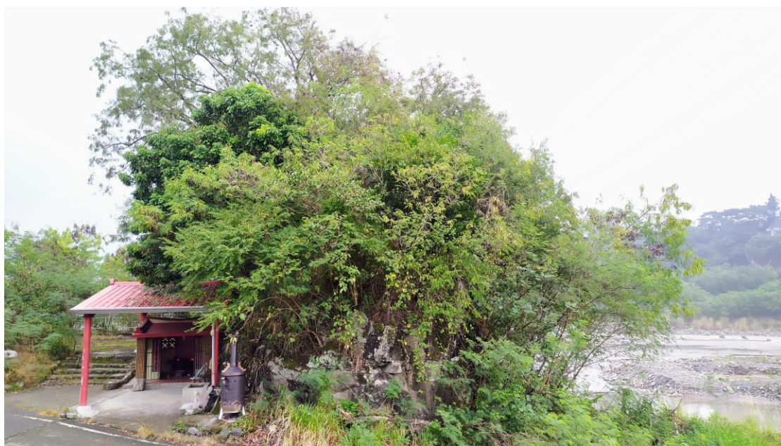
(老濃溪河床頂个「龜王岩」，這係六龜地名个由來)

包尾在「六龜老街區」个光復路，相借問老人家，佢正知六龜市區這位有當多人个阿公、阿爸係日本時代，從桃園、新竹、苗栗搬過來个客家人，佢兜毋係講北四縣，就係講海陸。六龜南片摺美濃、屏東合界个新寮、新威、新興三隻村，正係講南四縣腔个客家莊。六龜，做得講，摺全台灣各地个客家人擺合合共下。