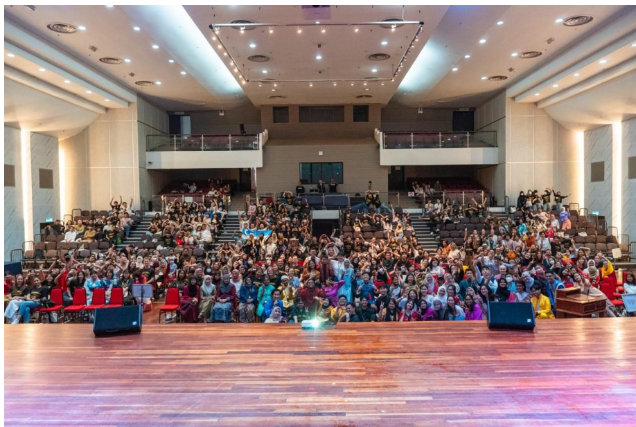
圖 1 由 UMGB 舉辦的 UMWOW 迎新活動，總共為期 3 天，最後一天為文化交流日，可以看到很多人穿著自己國家、族群的傳統服裝！

馬來亞大學是中央大學 110 年度新開放交換的姐妹校，是一所位於馬來西亞吉隆坡的國立綜合研究型大學，也是馬來西亞歷史最悠久的大學，是該國首屈一指的最高學府。馬大的交換生統一由 Global Enrichment and Mobility (GEM) Centre 負責處理各項事務，另外還有由馬大學生志願組成的 University Malaya Global Buddies (UMGB)，為交換生規劃一系列的活動，以便讓大家認識馬來西亞。可能是因為疫情剛解封的關係，此次到馬大的交換生人數高達 400 多人，來自 34 個不同的國家，其中人數最多的國家是泰國，接著則是日本、韓國。詢問過後才知道今年交換生中只有我一個臺灣人！以往會選擇到馬來西亞交換的臺灣學生也極為少數。