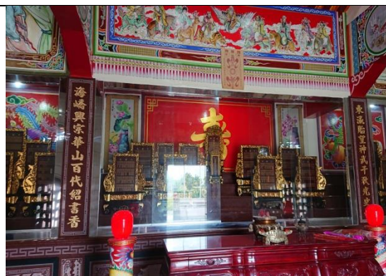
圖 6 阿公婆牌、廳對 (108.11.19 攝)