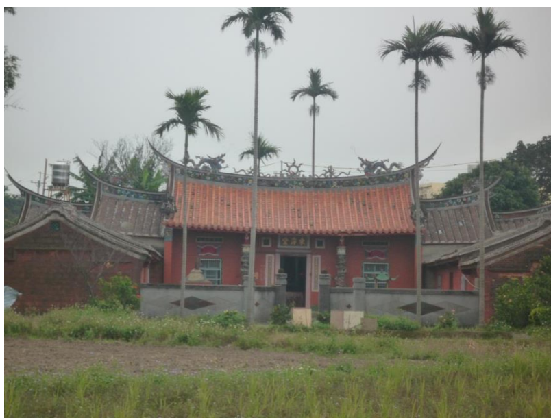
圖 2 原來正身公廳係民國 66 年農曆 8 月初 9 修整完成个，正身側賺同橫屋係大正 11 年修建个，起到翹哦翹棟。（99.12.19 攝）

從上一擺 66 年修整祖堂以來，經過三十零年；當時兩片側賺同橫屋係日本時代到今，無共下修整，乜有百零年咗！看起來舊陋舊陋，蠟礙 (lab ngai) 蠟礙，強強就會塌下來咗，無定著哪久風搓一來，怕會畀攞走囉！（圖 2）