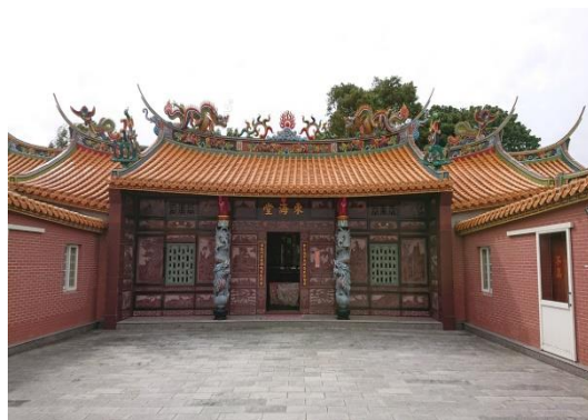
圖 4 102 年 11 月完成以後新个樣式 (108.11.19 攝)