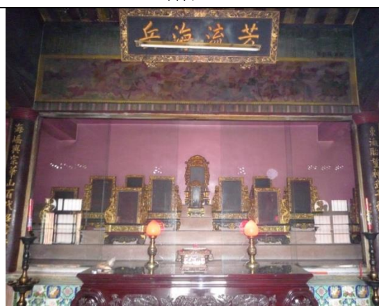
圖 7 阿公婆牌、廳對 (99.12.19 攝)