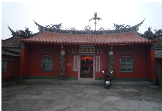
圖 3 102 年 3 月改建以前舊个樣式 (99.12.19 攝)