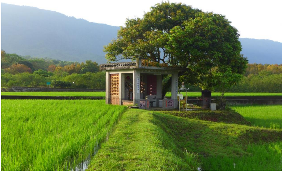
魏家庄內的伯公廟