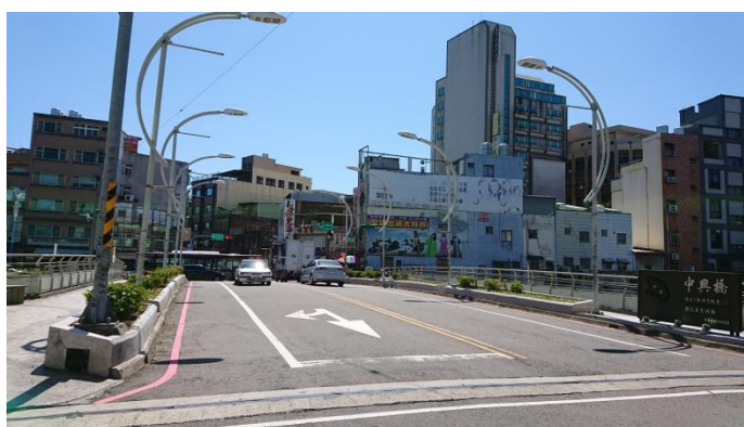
圖 5 中興橋（中山路）樣貌（108.8.31 攝）