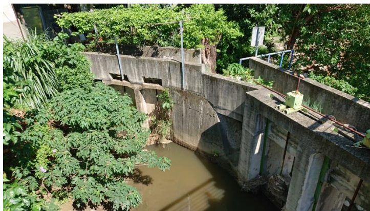
圖 2 興南堰（108.8.31 攝）

經過十年个烏天暗地，好得到二十年前，商場開毋成，環保意識探頭，縣長決心整治老街溪，還分老街溪一個原來个樣貌，開始拆忒揸起來做商場个建築。恁樣，流過中壢个歸條河壩回頭擺灌溉用个興南堰（圖 2）、新明堰正重見天日。還在源頭管制工業廢水，禁止排入河壩肚，河壩兩片疊起「壘石」工法，顯示客家流傳个石礮文化（圖 3）。在平鎮新勢公園下背設「污水處理廠」，處理老街溪上游流下來个污染水，在一入中壢个中原路下成立「河川教育中心」，展覽老街溪過去个生態樣貌，時時維護老街溪个清淨，魚仔慢慢仔洄轉來咗，夜鵝（圖 3）也不時看着。