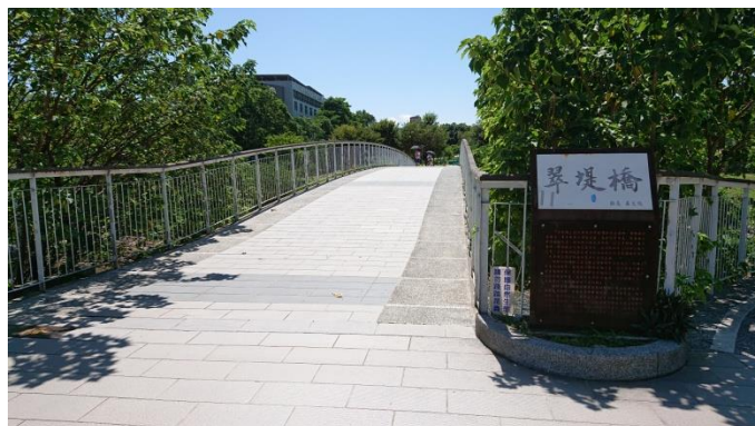
圖 4 老街溪進入中壢个第一座橋「翠堤橋」（108.8.31 攝）

自行車車道，各隻景點位所也有講解牌（圖 6）。逐條橋个設計都無共樣，分人感覺中壢有一份當有精神、當生活个都市樣仔。每朝晨、暗晡都有當多人在該散步、騎車仔，暗昏吔！在路燈之下，增加幾分仔个詩情畫意，同中壢化妝到靚靚。