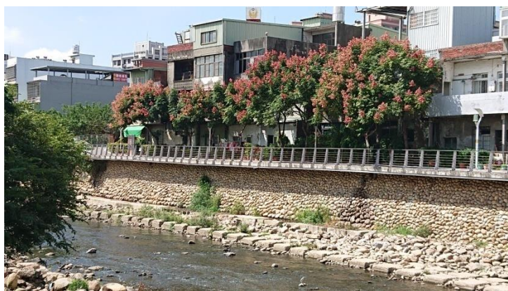
圖 3 壘石工法—石礮文化、河壩肚个夜鵝（108.10.11 攝）

老街溪流到新做个翠堤橋（圖 4）開始，就進入中壢區咧！經過中正橋、中興橋（圖 5）、中央橋、新明橋，一直到環北橋，區內兩片全部做好人行步道、