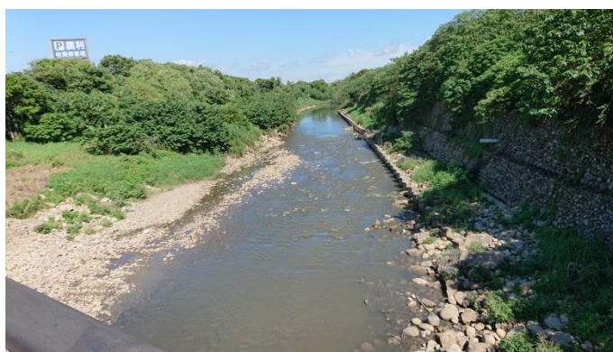
圖 1 過忒環北橋後流往大園个老街溪河壩 (108.8.31 攝)

老街溪在龍潭銅鑼圈東北个風櫃斗附近仔發源，順等店仔湖北片山排，流過龍潭陂、泉水空，平鎮山仔頂、北勢、南勢个合界，到伯公潭安到「南勢溪」。同西片另外一條在店仔湖岡背發源个大坑缺溪合起來，就安到「老街溪」。再到宋屋，穿過中壢老街、洽溪，到大園入海。(圖 1)