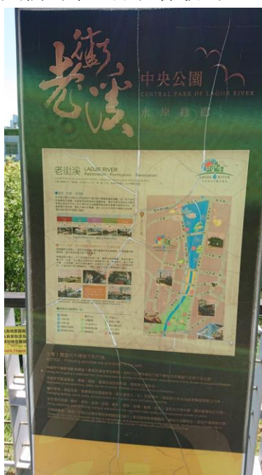
圖 6 解說牌（108.8.31 攝）