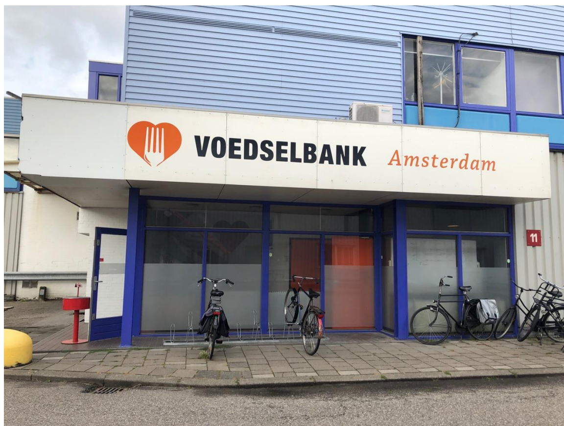
(阿姆的基地，門上的橘色logo在每個基地都見得到。)

在阿姆的基地，每個禮拜負責支援阿姆周邊將近七千多個家庭，離火車站才10分鐘的車程，但是卻全然變成一個工廠的景象，從公車下車的方向越往裡面走越簡陋，工作的地方嚴格說起來是個鐵皮屋，裡面擺設則像Costco。我在這邊的工作是把食物分裝，在海牙的基地則是負責發送食物。