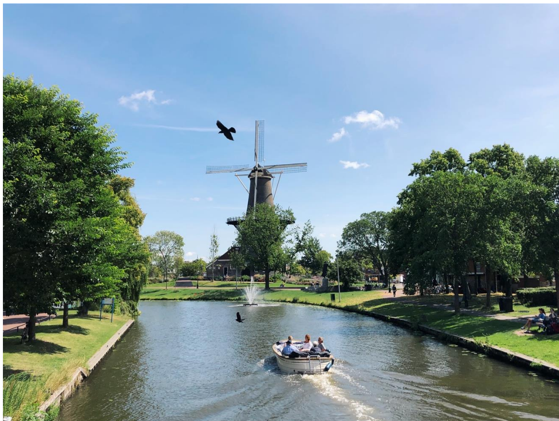
（號稱水鄉澤國的荷蘭，最經典的景觀：運河、風車、船。攝於海牙北邊的城市Leiden。）

食物銀行本身像一個社會防護網，接住那些掉到貧窮線之下的人，維持他們的生活水平，而幸運的是，我有機會成為網的一部份，在走訪城市之餘，也以直接的心力回饋這個美麗的國度。也許這也成為你下趟旅行的一部份。