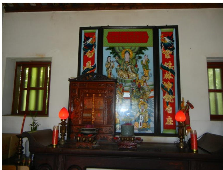
圖 4 徐屋阿公婆牌，主要從 17 世諸祥公傳下，貼忒部分係還在世个。

諸詳公降四個俖仔，因爭人口增加，陸陸續續起兩側賺个橫屋，慢慢仔變到左右各兩槓橫屋个伙房屋。到民國 38 年，將阿公婆分香過來，正身阿公婆神牌名除忒直系以上到來台祖玉韜公外，主要係諸詳公傳下子孫為主！（圖 4）