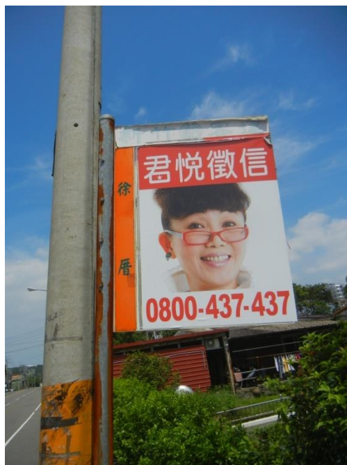
圖 5 「徐屋」个車牌名，打爽在客家庄寫「徐厝」。

徐屋个產業，早期除忒耕田以外，最主要係種茶同製茶，當時還冇有電，徐屋就自家買發電機，用機器製茶，賣到全台灣去。光復過後，經過耕者有其田、土地放領政策過後，田地少忒當多，後來製茶沒落，又再經過分家、賣忒，百零甲个田地伸無幾多咧！