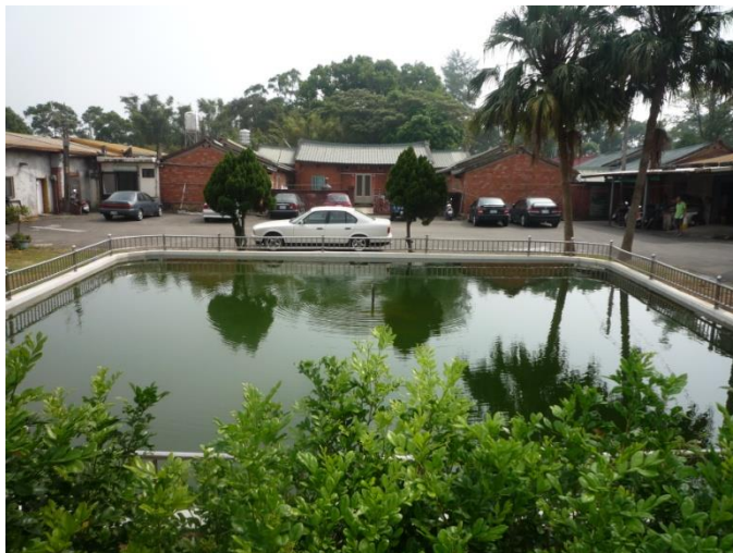
圖 3 徐屋伙房，面前還有一隻當大个陂塘

子抽到現居地兼龍潭个所在，目前總下就改建變社區咧；二房抽到八張犁舊公廳个地方，奉祀祖先；三子諸詳公抽到同林本源買來个地，結果諸詳公大約在昭和 1（民 15、1926）年開始起屋，到今有 90 零年个歷史地。（圖 3）