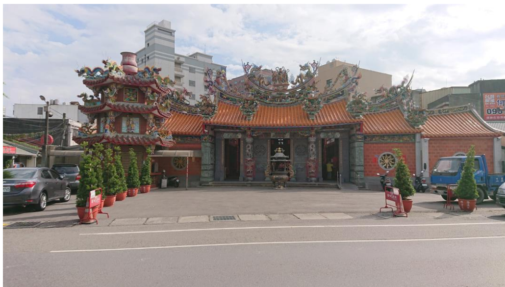
圖 1 頭重溪三元宮過廟後背个高樓（2018.11 拍攝）

還過一排排仔舊式个矮屋仔定定（圖 2）。毋過自從楊梅交流道通車過後，邊層發展當遠，高樓大廈一間一間仔起起來，頭擺人講「風吹牛鼻頭」个所在，這下也人尖人極吔！