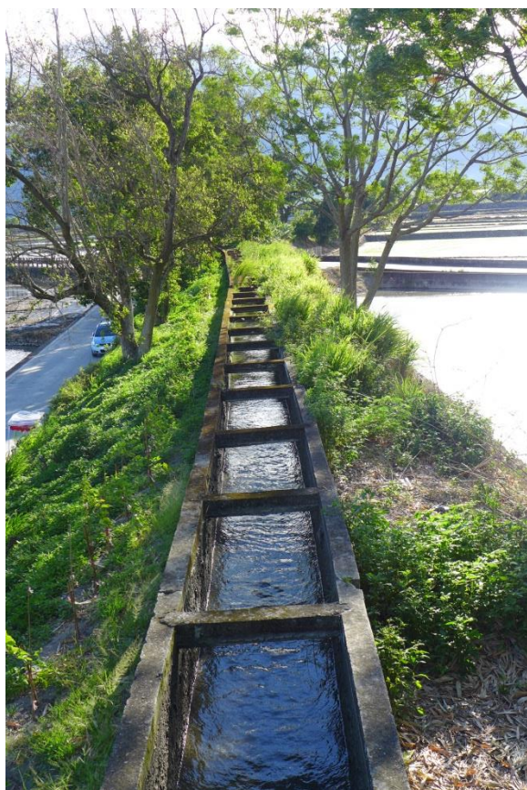
台東縣重要歷史建築——池上浮圳