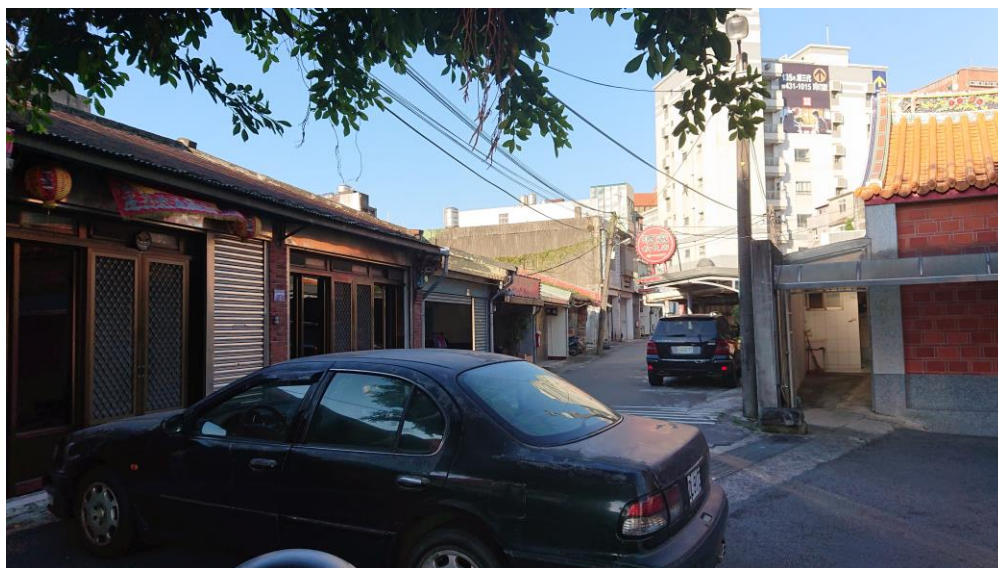
圖 2 頭重溪三元宮過廟層个舊矮屋（2019.07 拍攝）

還過一排排仔舊式个矮屋仔定定（圖 2）。毋過自從楊梅交流道通車過後，邊層發展當遠，高樓大廈一間一間仔起起來，頭擺人講「風吹牛鼻頭」个所在，這下也人尖人極吔！