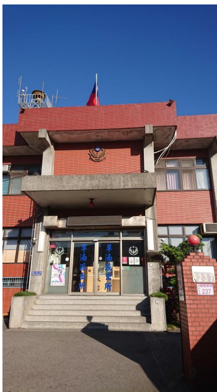
圖 3 草湳派出所（2019.07 拍攝）

埔心有火車頭過後，人口緊徙落來，形成街路、市場，慢慢變到「草湳坡庄」，到今也超過百年之久地！到這下，「草湳坡公學校」早就改到「瑞埔國民小學」；十過年前草湳坡也圍忒做路、做工廠，變到埔心車頭个後站。車頭面前个「平鎮旅社」同「平鎮醫院」跔等縱貫路拓寬消失忒地，就伸着車頭斜對面个「草湳派出所」還保留等草湳坡个舊跡，分後人懷想頭過个歷史記憶定定。（圖 3）