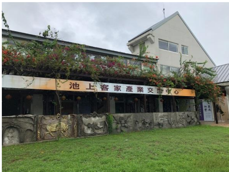
臺東池上地牛故事館 / 客家產業交流中心

一步有效聯結區域相關館舍，改為多元族群的多功能地方館舍。這樣才能有利於東臺灣客家文化館的永續發展，及客家與多元文化的共存共榮。