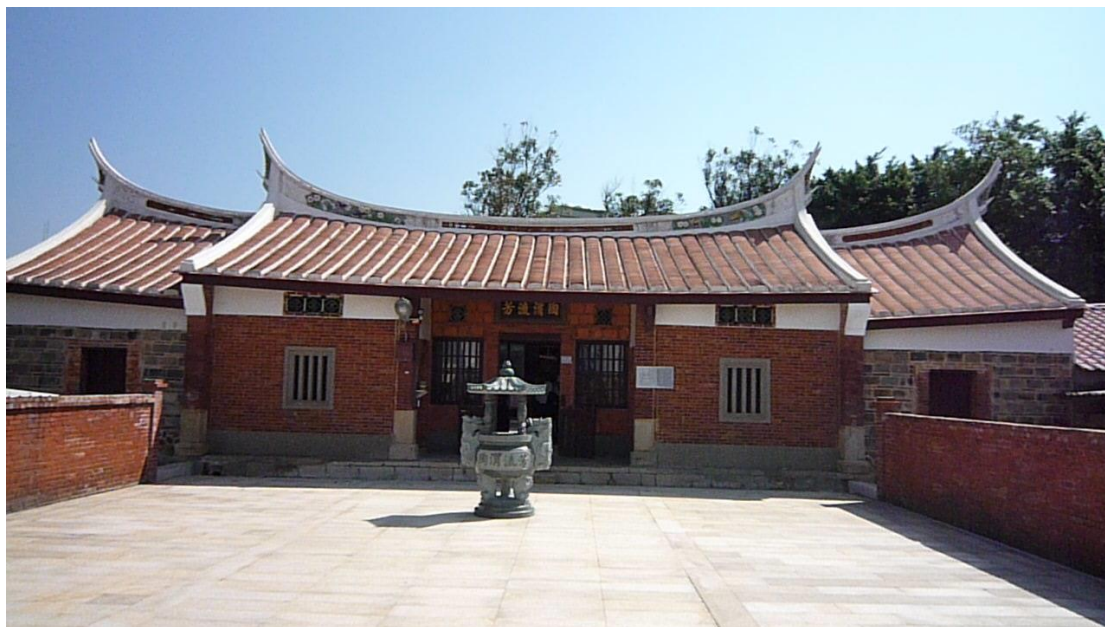
(圖一) 陶渭流芳 (98.10.29)