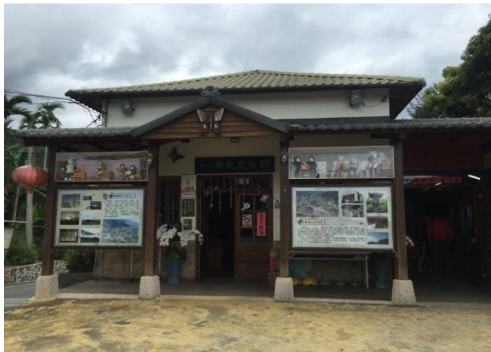
花蓮瑞穗拔仔庄常民文化館

鄉)，是早期富里鄉公所的所在地，今規劃為公埔文化館，透過公埔街區客家文化生活環境營造，作為具當地歷史特色的觀光資源休憩中心。