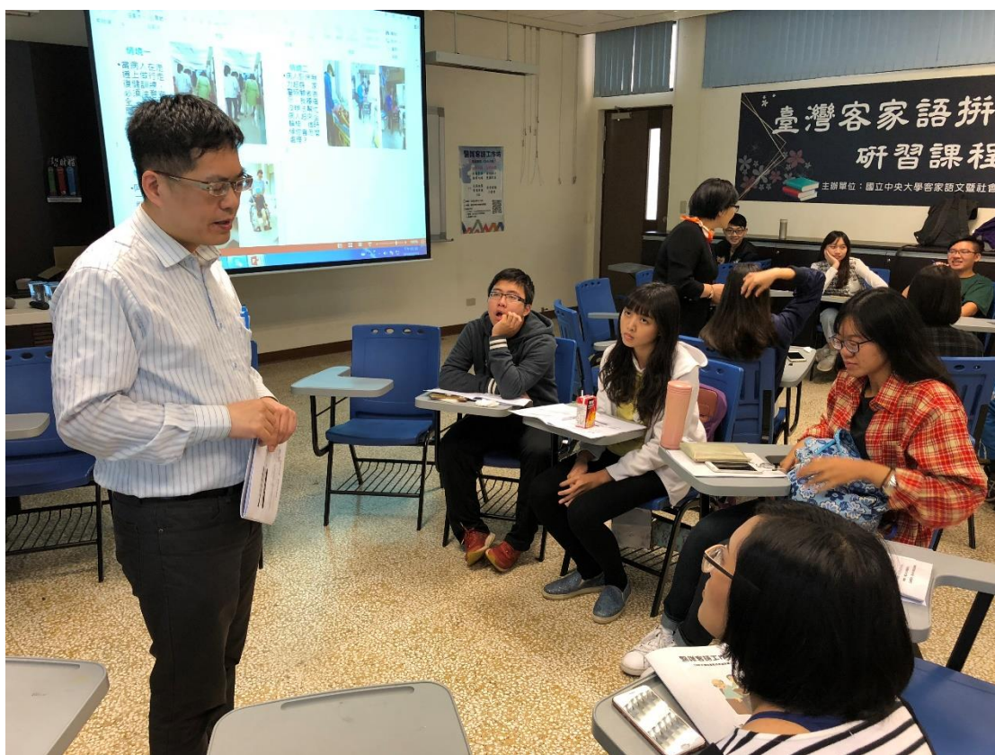
壢新醫院的授課講師群也為學生設計了一系列的模擬情境練習，在病房關