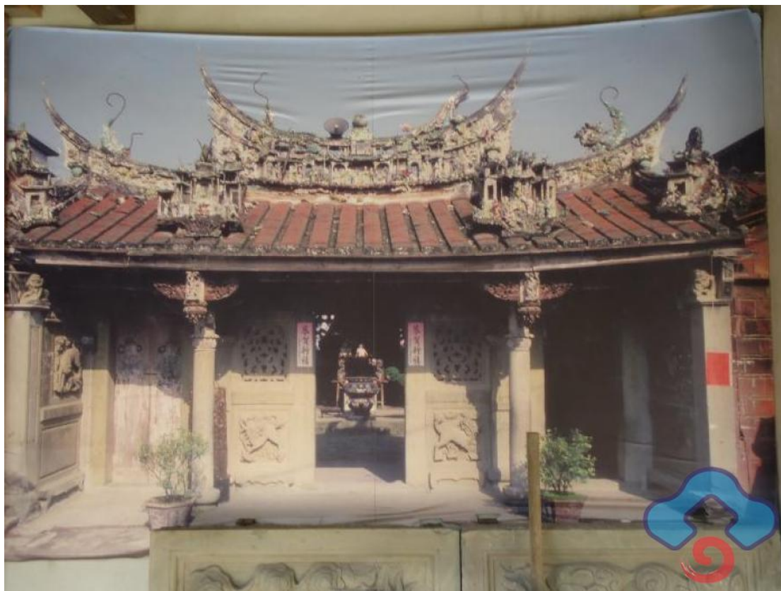
(富興隆聖宮。圖片取自 客委會客家典藏 )

【文 / 曾俊鑾 / 國立中央大學客家語文暨社會科學學系客家語文研究所碩一 朗讀 / 徐翠真】