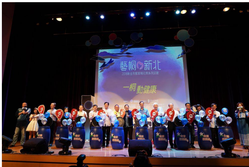
【2018 新北客家桐花祭啟動儀式一桐揭開序幕】