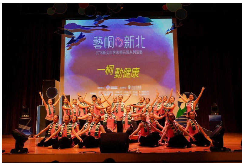
【新北清水高中呈現桐在新北動健康客間操的青春活力】