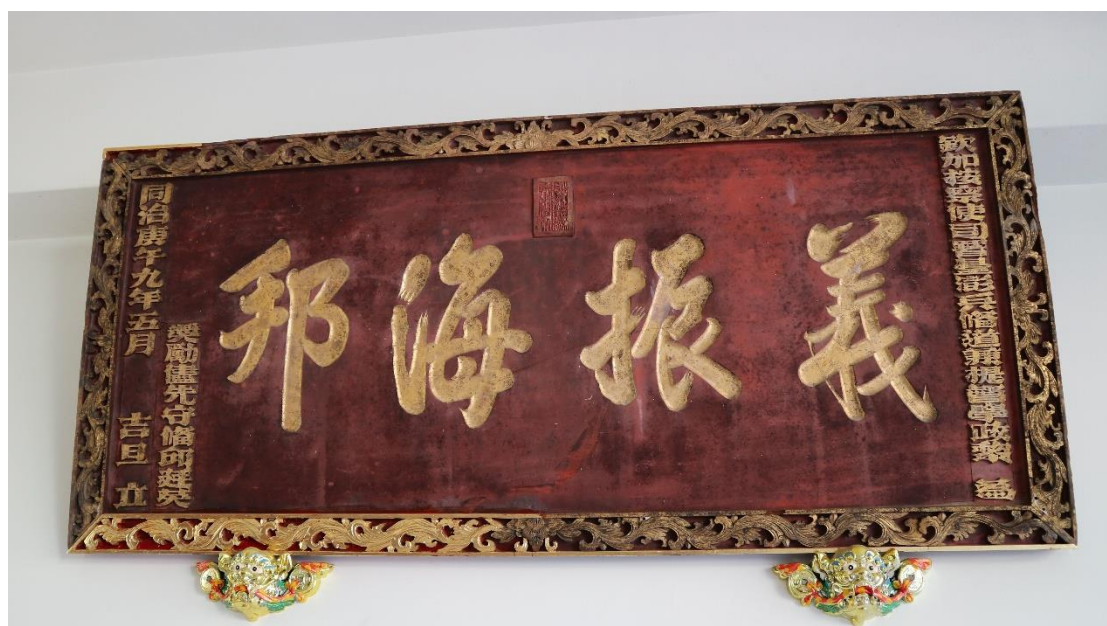
【清同治年間朝廷頒給邱家的匾額，在 921 大地震時因房屋震垮而稍微受損，左下角金邊鑲框為重新補修。】

在和煦冬陽配合下來到邱國源先生寬敞透天屋門口，他已在院子裡等候半個多小時。精神抖擻、笑容可掬的邱老外型，與他的年齡真不相符呀！邱老述說當年他在東勢衛生所當技士時曾救助過許多人，像有一個年輕少女跳樓輕生被他救活，後來又想不開尋短，令他唏噓不已；有一天路過一家造磚廠，有一個妙齡女工因地震被倒塌的磚牆壓住，他協助送醫並幫忙截肢保命，後來這個女子去學裁縫，有很好的歸宿，令他感到欣慰。