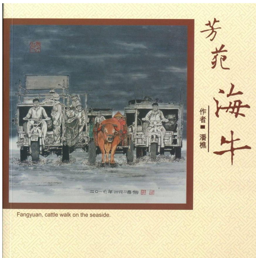
Fangyuan, cattle walk on the seaside.