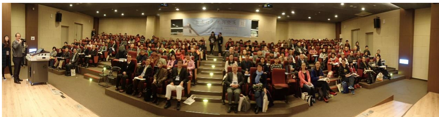
「客家的形成與發展：台灣與新馬的比較」國際學術研討會合照

總合客家運動三十年以來，前十年以文化為主題，積極搶救語言、戲曲、歌謠、音樂、教育、宗教信仰，但係除忒語言以外，都還言成立研究所來做還較深入研究。中間十年，積極推動各項文化語言个建設，成果有還算豐富，可惜忒偏重經濟（經邦濟世），無特別重視本質，係使人擔心个所在。像十二庄節慶个成果，無特別个客家特色，已多人講，這就係言討論清楚就愕愕然訂出各項推動補助，變成鬧熱有餘文化不足。又像客家日个選定、客家桐花等代表客家符號个推展，同客家本質都有一段距離。真希望沉浸式教學或母語實驗學校个推動，做得積極擔任搶救母語个任務，恁樣个運動，正做得得著盡長遠个迴響。