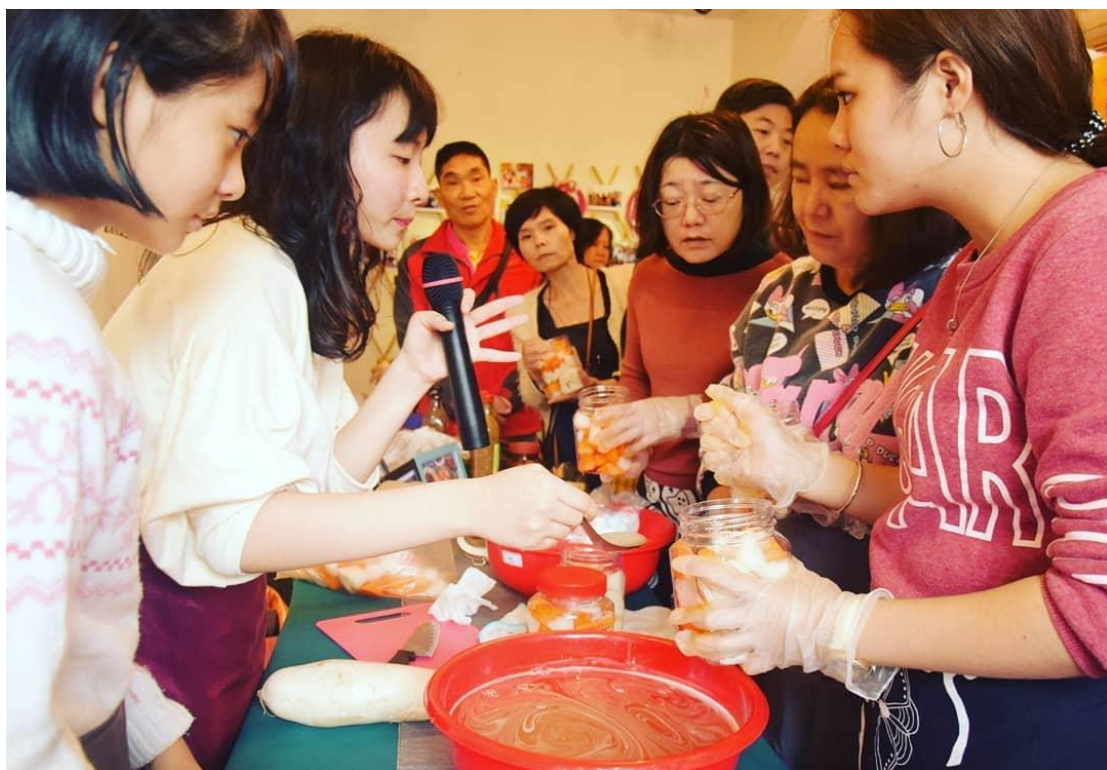
【圖一，為將醃過的紅白蘿蔔加入醬料的過程】