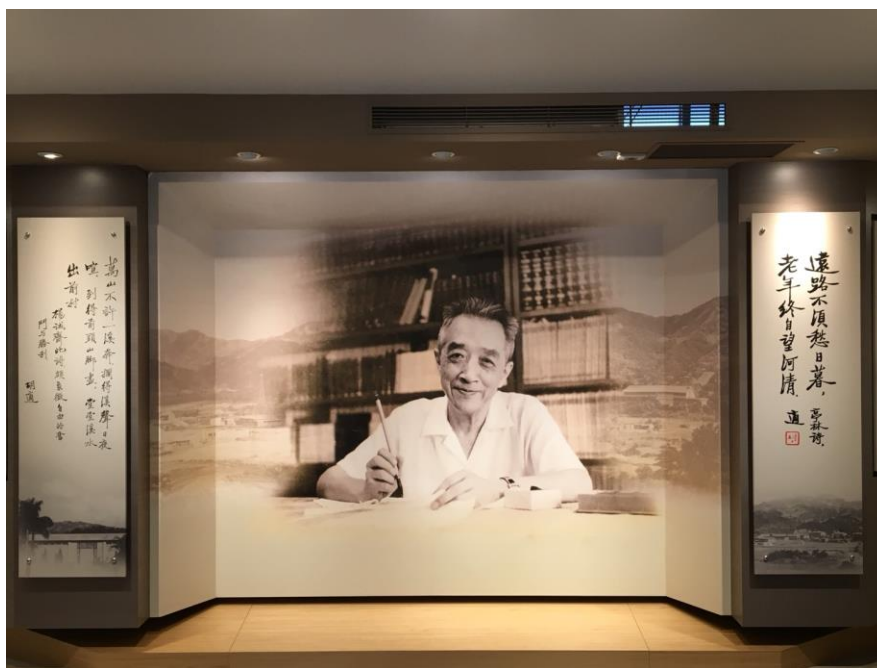
【胡適紀念館】

接著，我們到人文社會科學聯合圖書館來參觀裡頭的館藏書籍，這棟圖書館的藏書非常的豐富，若不是需考量時間，我真的很想在這裡待到晚上，這邊有很多的書籍是在其他地方借不到或看不到的！在參觀環境時，有留意到一棵非常漂亮的櫻花樹，近看才知道是假的，遠看就像真的一般，這時腦中突然浮出櫻花如雨飄下的畫面，自己彷彿就站在櫻花樹下！