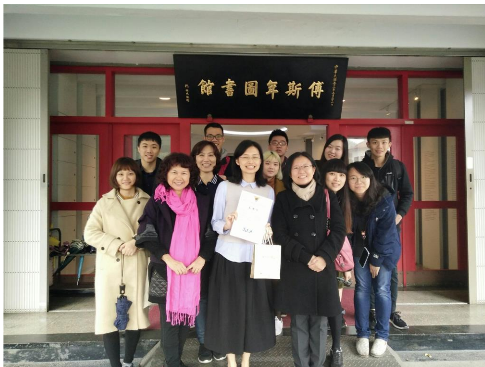
【與館長合照】

用完午餐後，離下午的行程還有一段時間，老師帶著我們到胡適紀念館參觀，胡適先生生前是中研院的院長，所以在他死後，他被葬到這附近，也是現在看到的胡適公園，公園除了有胡適的墓，還有他的墓誌銘，聽說這邊到了假日會有很多父母帶著小孩來走走，享受週末的悠閒時光。