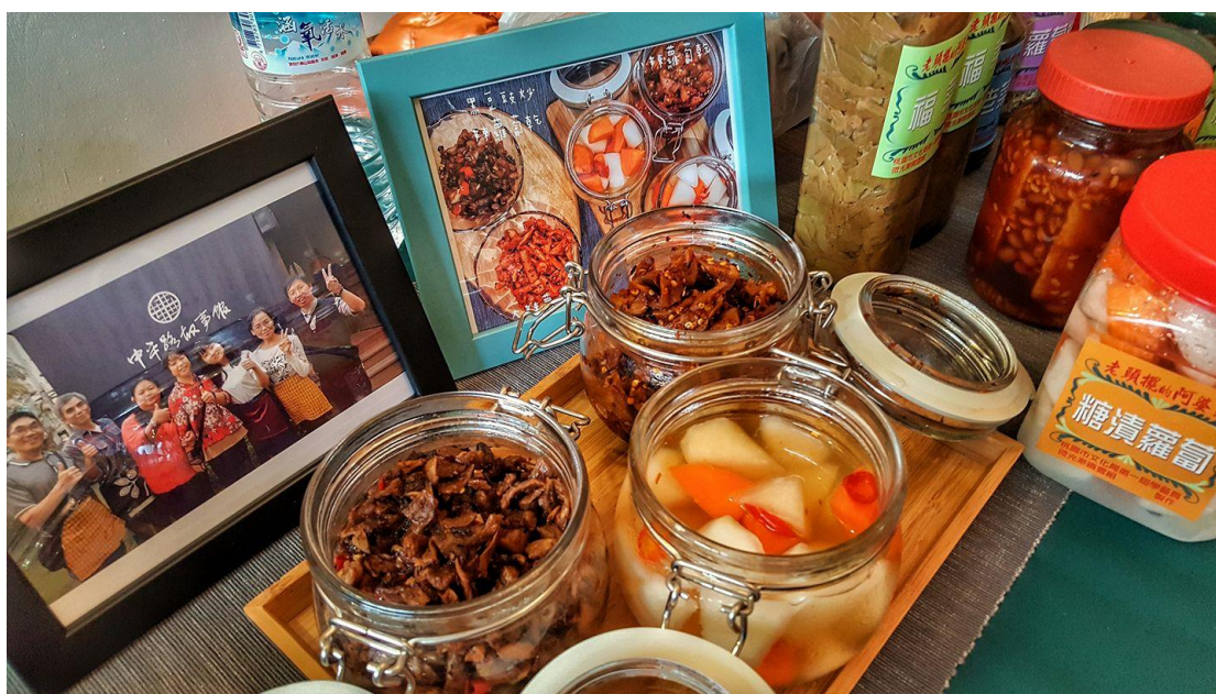
【圖四，桌上擺放了供學員試吃的漬蘿蔔與示範蘿蔔乾的小菜應用等】