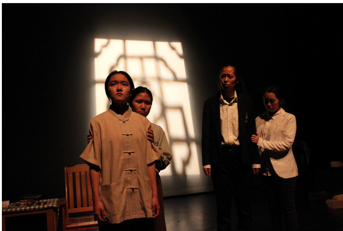
【劇照 圖／文學與劇場課堂呈現】

在舞台劇中，我最專注於表演領域。抱持著更深入了解舞台劇的態度，學習其他專業，比如說：音樂設計、舞台設計、燈光設計、舞監等等。原本我對舞台劇的想像是人文的、藝術的、表象視覺的，經過一堂又一堂的課程，我發現舞台劇不只是人文藝術，更是包含了許多科學專業，像是燈光設計中光的原理、舞台設計中的空間概念以及機械物理知識。這讓我覺得劇場非常不簡單，為了呈現給觀眾一齣齣好戲，集結了許多方面的專業人士，在一段時間密集運作之後，才產出一部作品。