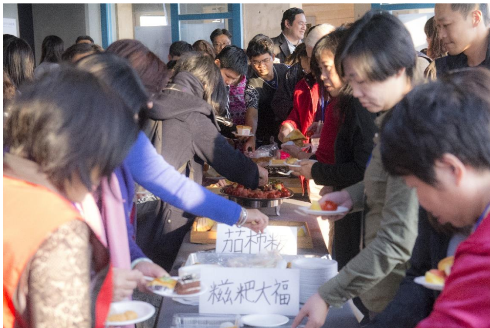
【中場休息與會者享用豐盛的點心】