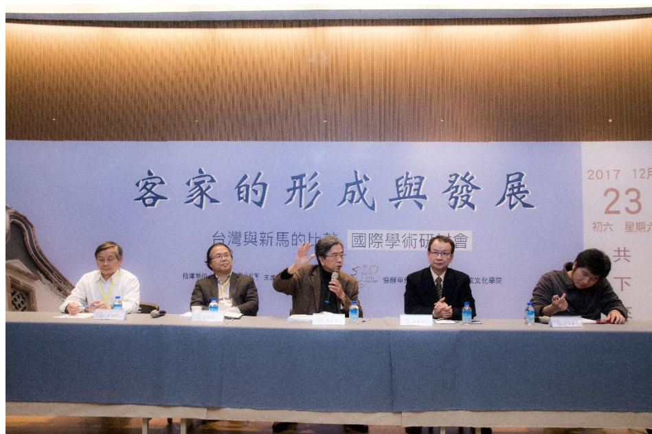
【蕭新煌資政主持綜合座談之情形】