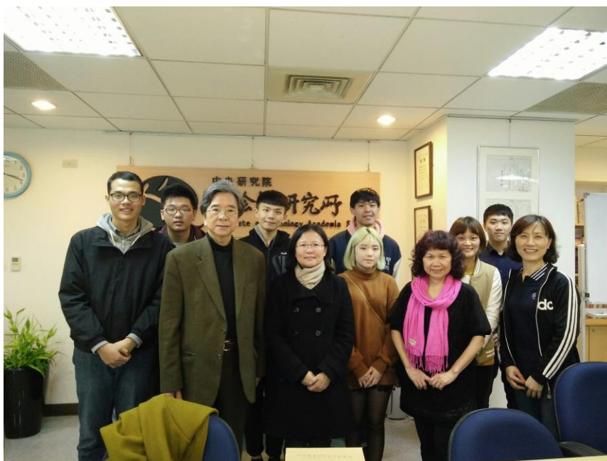
【與蕭新煌教授合照】

這一次來中研院參訪，就像劉姥姥逛大觀園般，是一個新奇與寶貴的經驗！更棒的是，也接收了好多能用在研究上的資訊，為自己的研究生涯多了一個很與眾不同的經歷！