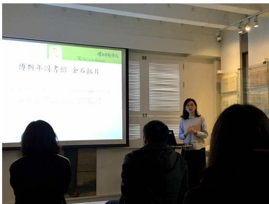
【傅斯年圖書館館員導覽介紹】

到了中央研究院後，我們先到傅斯年圖書館，聽館員為我們做導覽，聽完導覽後，又更了解原來圖書館的資源這麼的多，連一些較舊的文獻，都能夠在這邊找到以及利用！