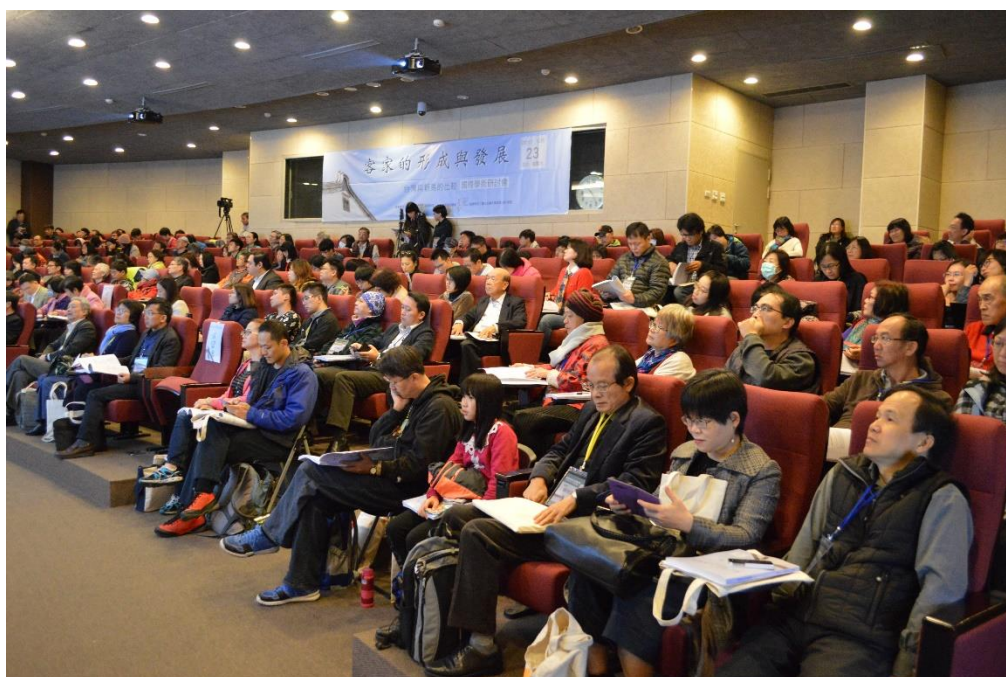
【與會者專注聆聽之神情】