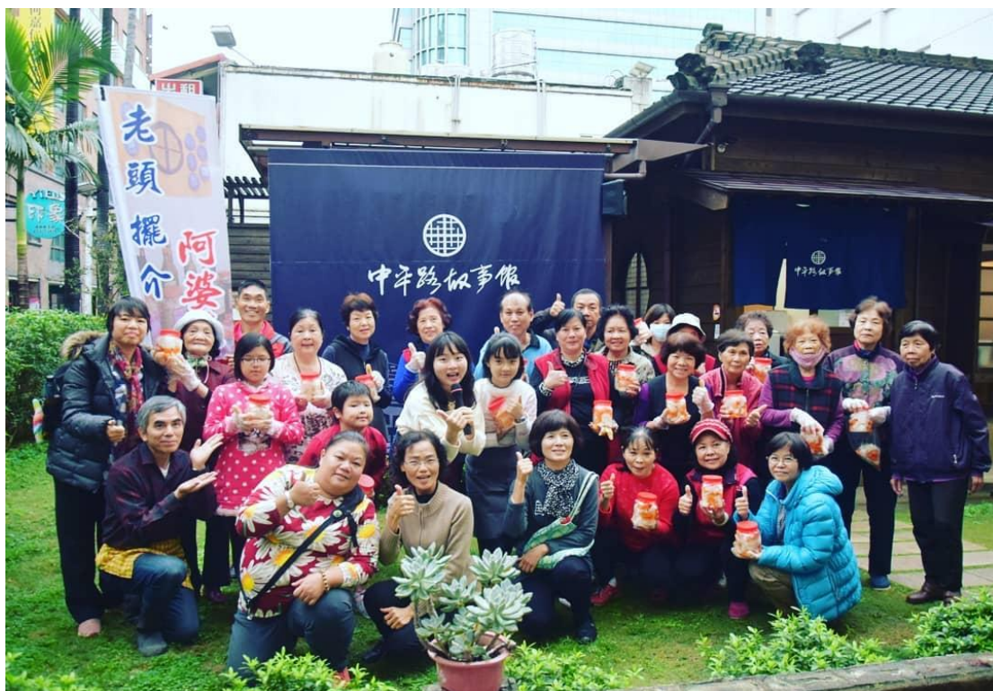
【圖三，為中壢區石頭里里民設計的蘿蔔醃漬第二回合及第三回合活動】