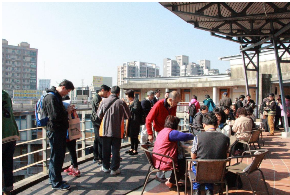
【中場休息與會者茶敘交流之情形】