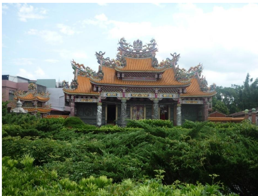
(圖 2：民國 89 年新建完成个葉奕明公祠 101.08.25)