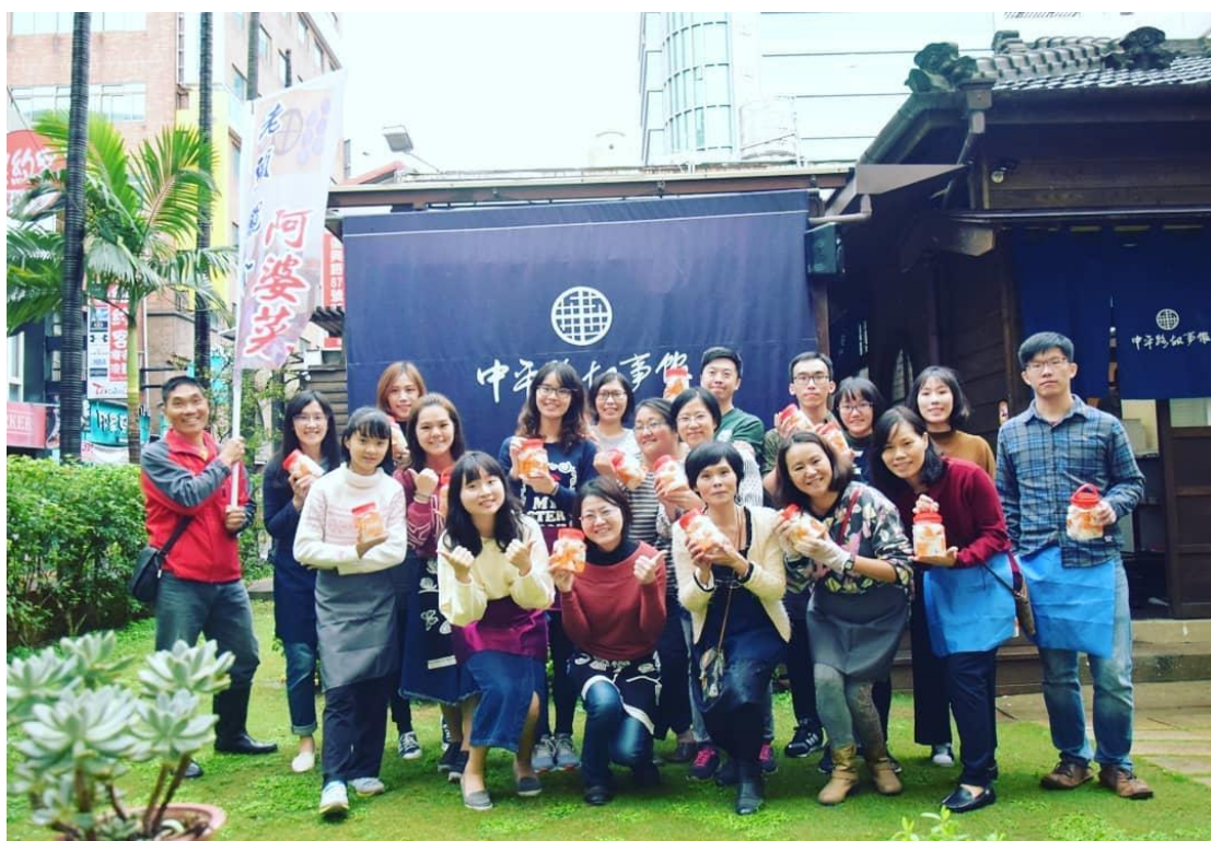
【圖二，為網路及電話報名的蘿蔔醃漬第一回合的學員】