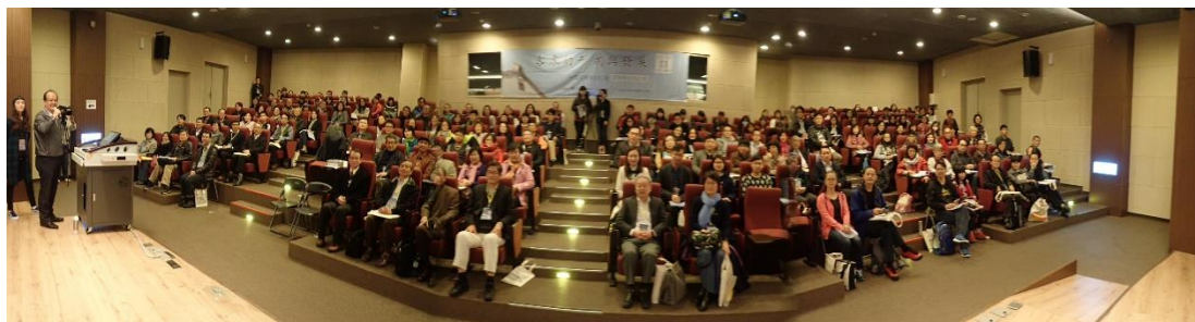
【開幕式後所有與會者大合照】