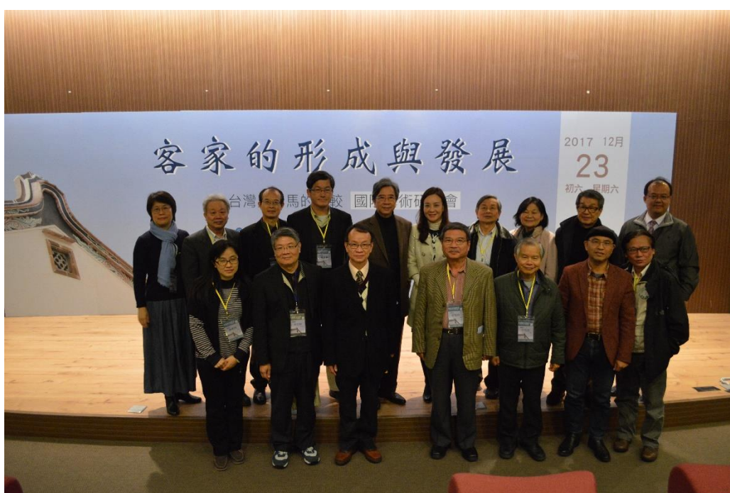
【開幕式後所有與會貴賓合照】