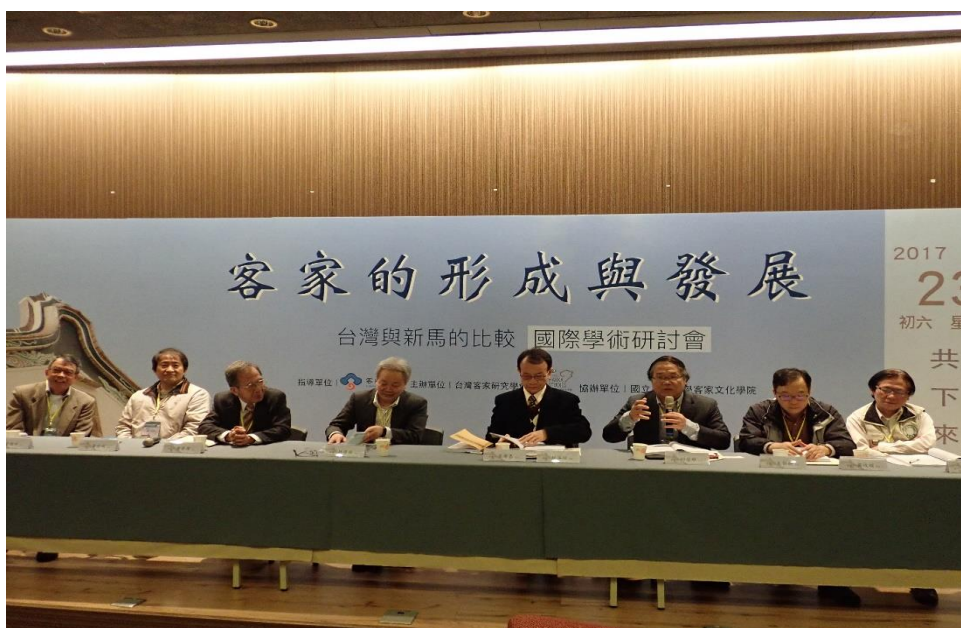
【學者發表論文的情形】