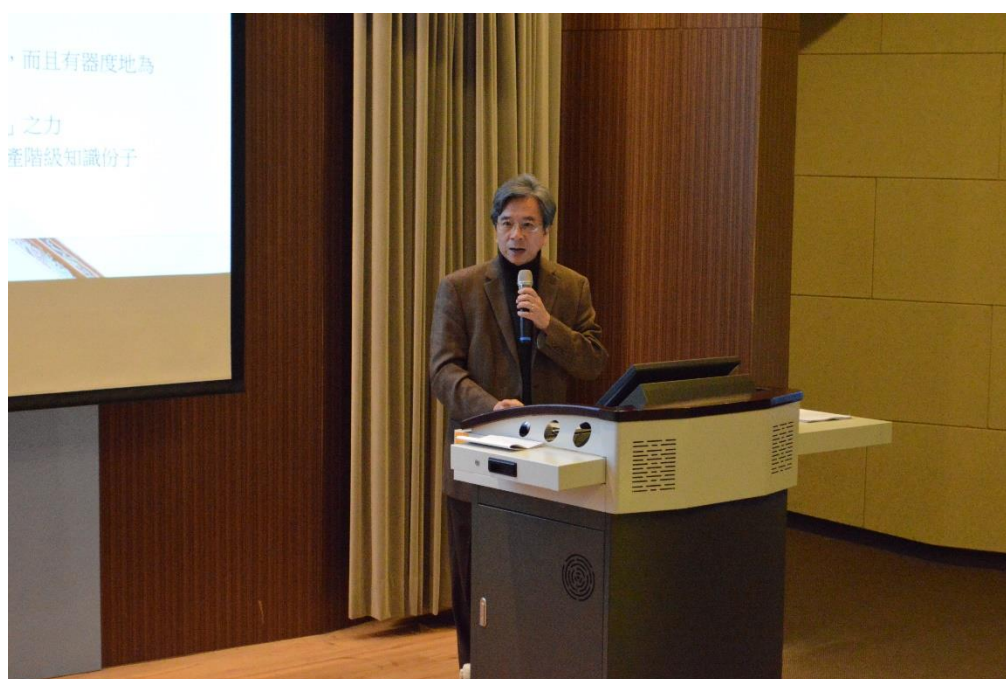
【蕭新煌資政發表主題演講之神情】