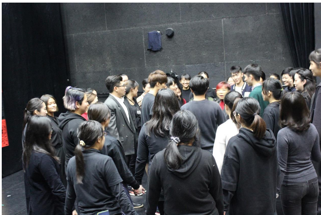
【排練照 圖 / 文學與劇場課堂呈現】

所有課堂中，我最喜歡的當然是那三堂表演課。即使許多課程以前在表演工作坊便有上過，但老師不同的引導方式，以及不同的合作夥伴，讓相似的課程也有了意外的收穫。我喜歡在探索自我身體的活動中，與自己相處，與自己身體對話的過程。正因為平時都與電腦手機為伍，與同學朋友玩樂，不可能有這樣的經驗，所以我更加珍惜；我們在舞台上跑跳、翻滾、吼叫、遊走、平躺，傾聽自己的心跳聲，觀察自己的情緒起伏，每一次活動都讓我覺得非常非常的放鬆，那不是睡了十個小時或聽了一下午音樂可以達到的效果，而是感到身心靈真正自在了。