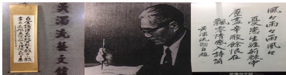
【吳濁流藝文館〈圖一〉/引自吳濁流藝文館〈圖二〉/吳濁流先生手跡〈圖三〉】

今天是苗栗西湖與銅鑼校外企業參訪一日遊，菊芳老師帶隊。羅老師說苗栗有大湖、二湖、三湖、四湖、五湖沒有六湖、七湖、八湖，有九湖，四湖改西湖，和大陸西湖沒有關係，早上 8：00 從中央大學客家學院旁廣場集合出發。