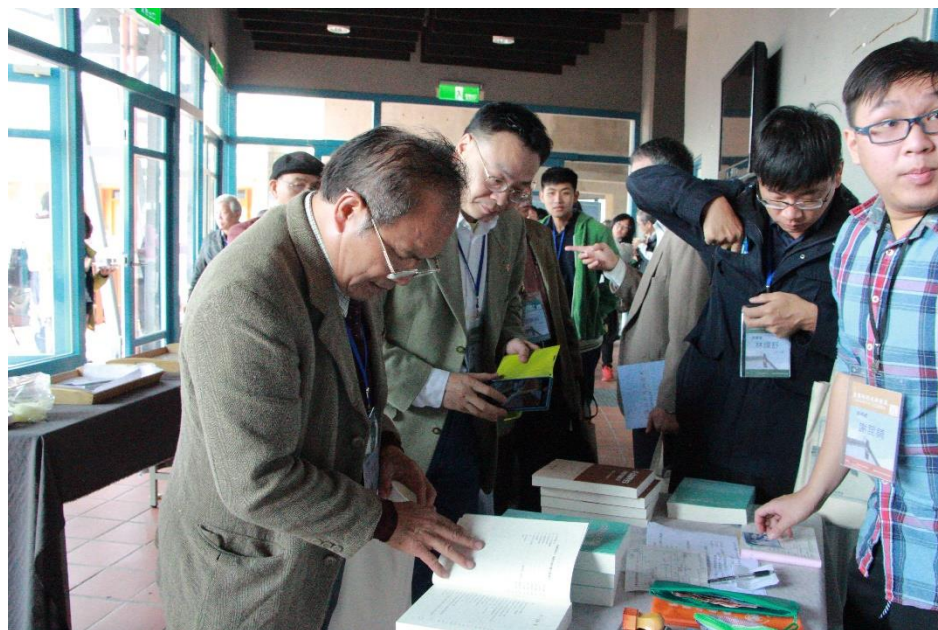
【與會者利用中場休息時間購買學會出版書籍】