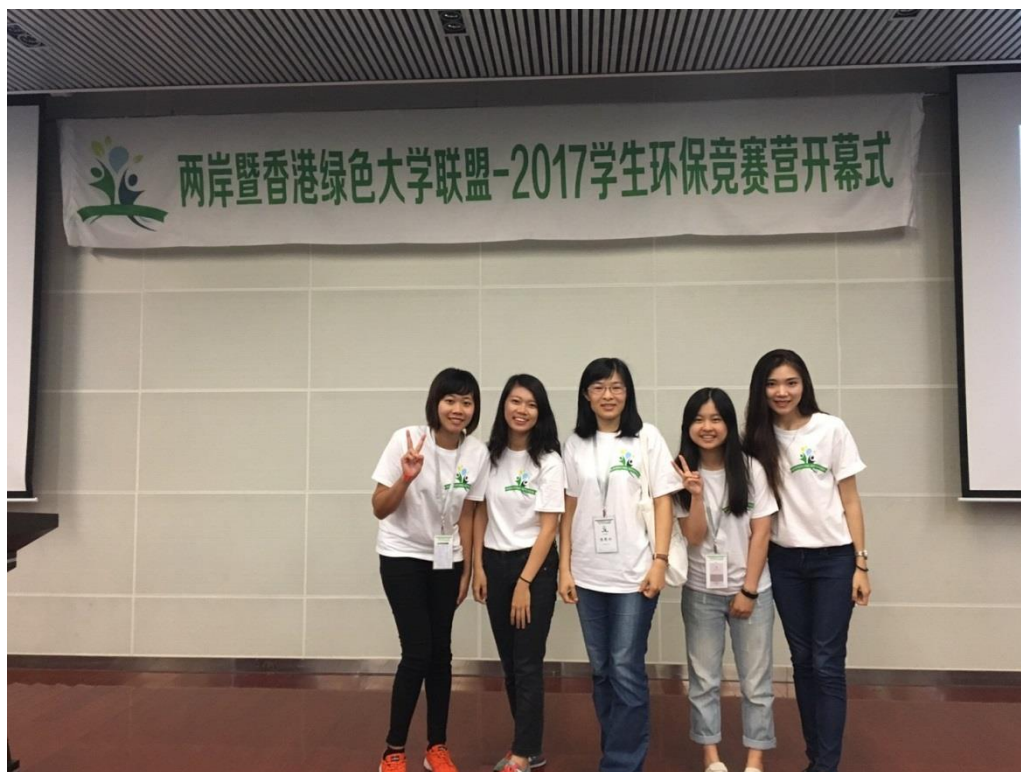
【報告展示會後 圖／李宛諭】

我們來自不同的地方，卻同樣在未來這條未知的道路上前進，當我們跨出舒適圈，才能看見世界有多寬闊，在這當中也才能細細體會社會結構、各國社會問題，共勉之。