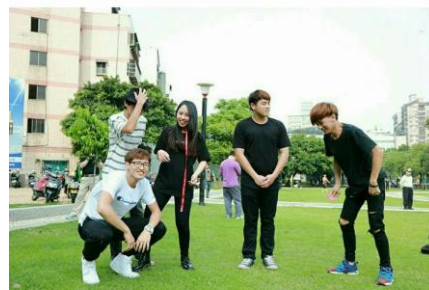
【空氣玫瑰學生樂團】