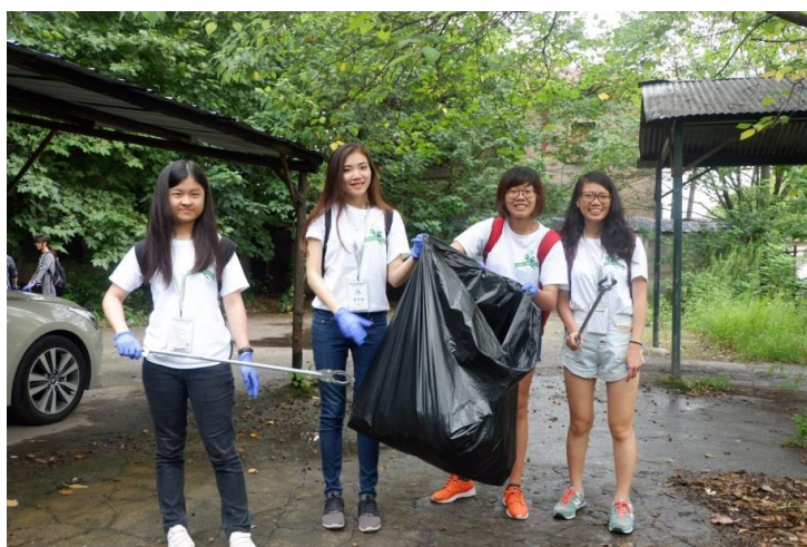
【環境清潔實踐計畫 圖 / 2017 兩岸暨香港綠色環保競賽-中央大學團隊】

還記得一開始，自己在校內報名的最後一天的中午看到了海報，憑著一股衝動我問了其他同學要不要一起參加。下午三點，一個小組才正要形成，五點我們就必須發想並且提交作品構想，腦力激盪此時才正要開始，誰又會知道這個想法居然伴我們走過了四個月。在此次比賽當中，最原先的想法僅是希望解決中國大陸資源回收現況，在組內討論時一開始還曾開玩笑說「他們如果做好垃圾分類一天大概是我們的一年吧！」至此，「Sharing Eco」一台智能回收機器在一次又一次的討論中漸漸成形，運用了光學、物理、APP 等不同的理論，最後再搭配社會關懷，我們將這些成果從臺灣帶到了大陸。