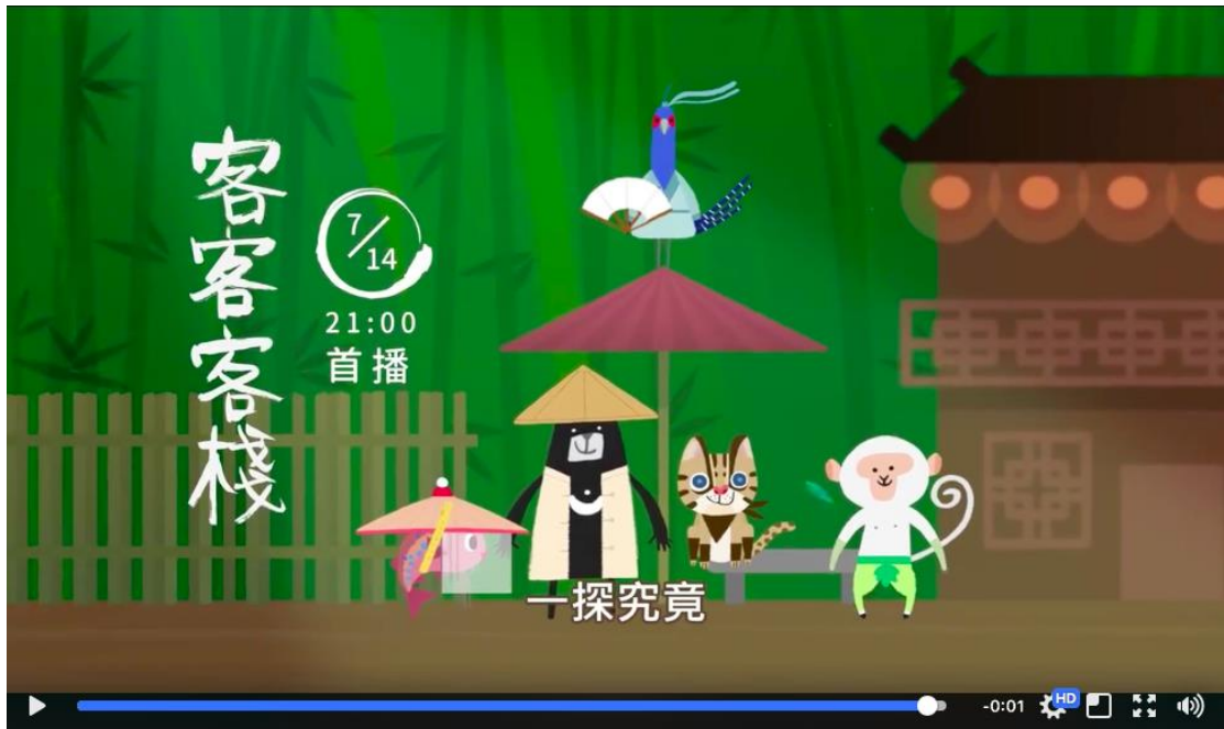
【圖 / 客客客棧大開場影片截圖。擷取自「臺灣吧 - Taiwan Bar」粉絲專頁】

社群網站《臺灣吧 - Taiwan Bar》和《客家電視》聯手製作的特別節目《客客客棧》，不僅於日前入圍金鐘獎動畫節目獎，近期更挾帶高人氣，著手企劃第二季，是新舊媒體合作的創舉，為客家文化的傳播添上創新色彩。節目內容由臺灣吧原創角色黑啤、白米等主演，以武俠風格貫穿全場，深入淺出的方式使閱聽人輕鬆涉入影片情境，傳遞及教育客家文化歷史脈絡的主旨。相對於以往僅由文字表達的方式，動畫更能夠使人印象加深，至今「客客客棧」系列節目已累積突破百萬觀看次數，有這樣的成績，社群網絡的快速傳播功不可沒。