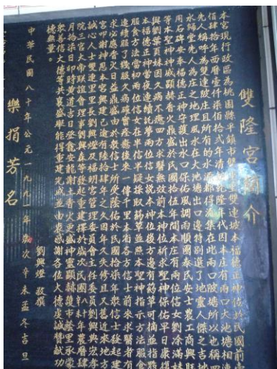
圖 3 雙隆宮簡介石碑第三行下到四行書「四水歸堂」(徐貴榮攝 990613)