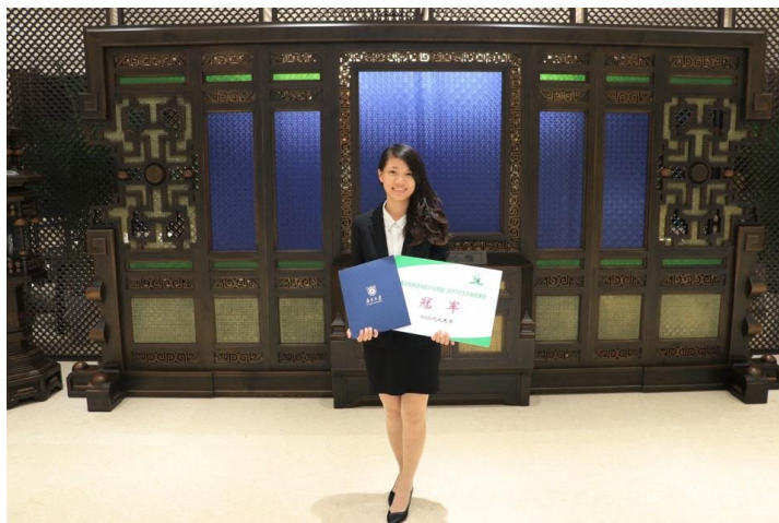
【2017 兩岸暨香港綠色環保競賽】

一開始誤打誤撞組成的小組，到後來到南京參加此次比賽，甚至得到第一名，回國後許多家報紙的報導，這一切對我來講都像是一場夢。