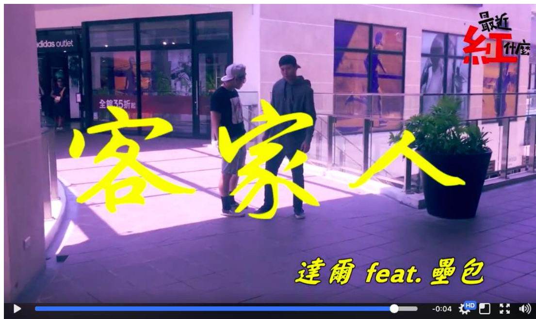
【圖／饒舌單曲【客家人】影片截圖。】

演》製作客語教學搞笑影片、《最近紅什麼》搭上饒舌熱潮，發布饒舌單曲【客家人】及《喊切！Hakafa》改編「六個姐姐一個哥哥」客語版等網路紅人團隊，綜合高達數十萬的觀看數，登上 Youtube 該週發燒影片，群眾的支持在在引發閱聽人學習母語的動機，除了傳承更是為一項不可多得的技能。