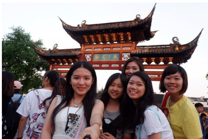
【遊歷總統府、夫子廟參訪 圖 / 李宛諭】

結束了兩天的自由行後，我們迎來的是比賽的日子，此次總共有六所大學（中央大學、南京大學、成功大學、北京師範大學、浙江大學、香港中文大學）。報告展示的日子是在前幾天，所以前幾天的晚上我們絲毫不敢鬆懈，每日活動結束後就在飯店準備簡報，但在比賽前一天，已經做好的報告一直出現問題，圖片跑不出來、字型跑掉、檔案壞掉等，也讓我們的心開始緊張不安，最後完成時間也因此拖到了很晚，所有一切也都在不確定的晚上暫時告一個段落，早上我們最後再核對過了所有的事情，至少確定不要有太嚴重的錯誤在其中，一切也算是滿順利的結束了。在比賽過程當中我們也遇到了來自不同學校的學生，每個夜晚我們都在房裡玩桌遊，討論兩岸不同的樣貌，或者自己的學科、夢想，跨過政治的藩籬，我們在這當中討論著彼此對於未來的展望。