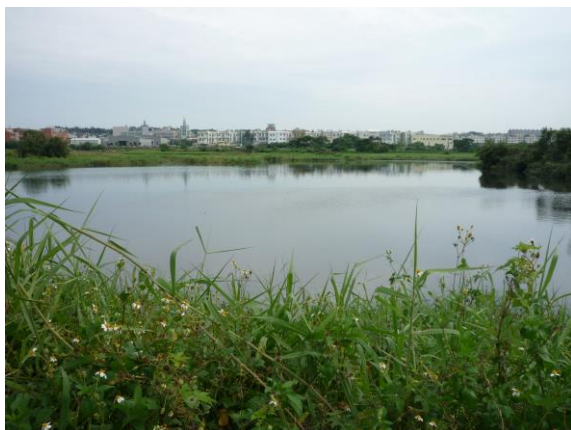
圖 1 雙連坡

註：四水歸塘：原稱「四水歸堂」，雙隆宮內碑文亦寫「四水歸堂」，原意為「房子各屋面內側坡的雨水都流入天井，寓意為水聚天心」。然本文所指為附近水流都流入「雙連坡」這兩座池塘，故取其諧音稱為「四水歸塘」。