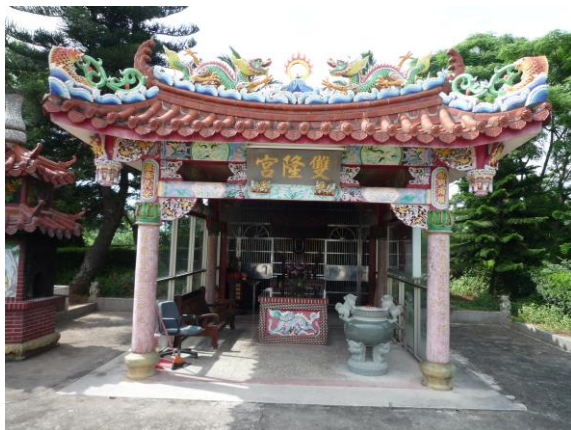
圖 2 雙隆宮 (徐貴榮攝 990613)