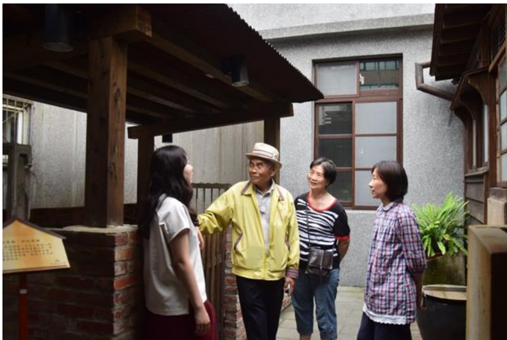
【向民眾介紹建築後院維持一家溫飽的豬圈，並談起民眾其童年時期在家中餵養豬的相關經驗。】