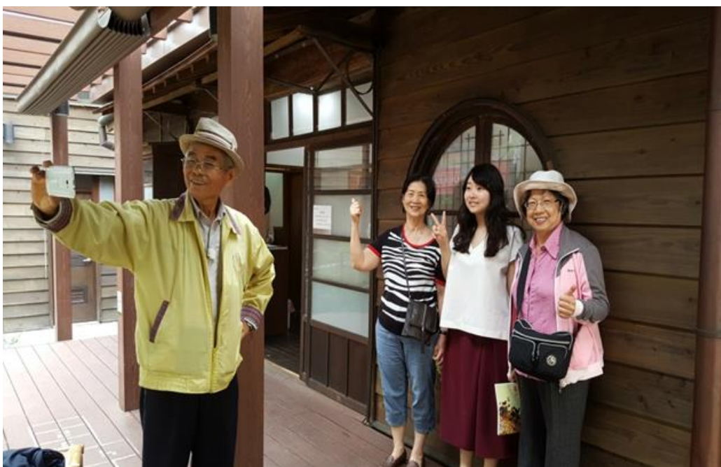
【由左到右 60 歲的阿公、阿婆，以及 80 歲的阿婆，離開館所之前阿公拿起手機一起自拍，記錄合影。】