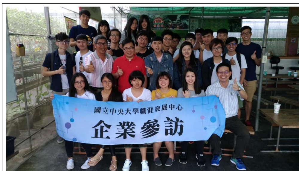
於優恩蜜果園的大合照

從書中看得再多，比不上親眼所見，參觀果園的時候，感覺到同學們的眼睛都亮了起來，和聽講時不同，用充滿好奇與驚嘆的眼神看著那些蔬果，時不時拿起手機紀錄，又或和身旁的同學討論，想必是個很有收穫的時間。