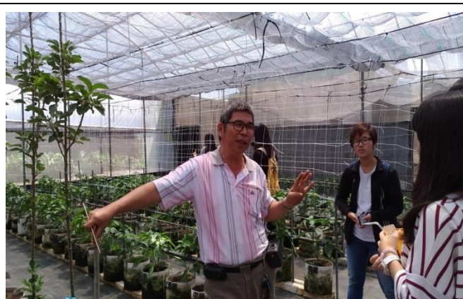
回應同學們的提問

從書中看得再多，比不上親眼所見，參觀果園的時候，感覺到同學們的眼睛都亮了起來，和聽講時不同，用充滿好奇與驚嘆的眼神看著那些蔬果，時不時拿起手機紀錄，又或和身旁的同學討論，想必是個很有收穫的時間。