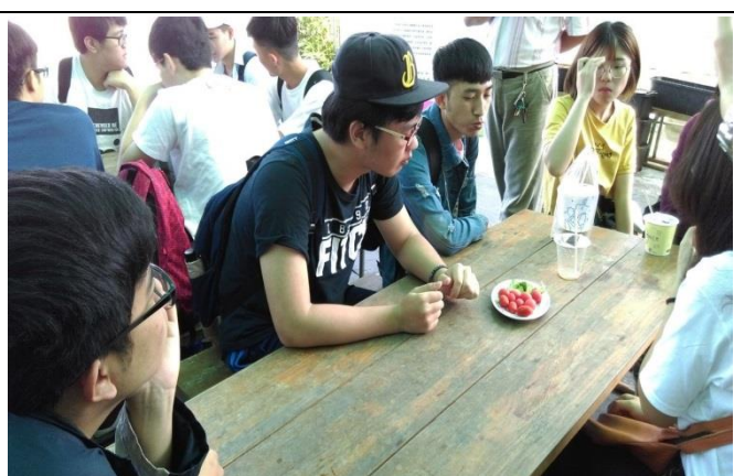
品嚐有機的番茄與小黃瓜