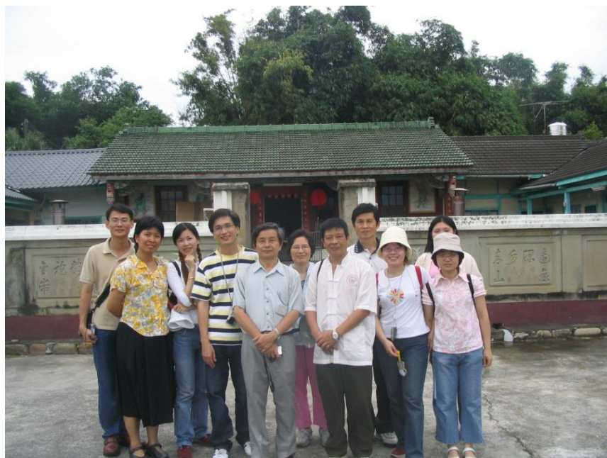
【2005.6.28 率領中大客家學院客家語文所第一、二屆學生前往苗栗田野調查，於銅鑼鄉往通宵 128 縣道旁參訪李屋祠堂前合影。 】