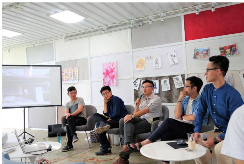
【回自己的小宇宙來一場小實驗吧】

回到我們自己的生活、自己的崗位上，我們可以怎麼做呢？不禁讓我想到我喜愛的教授時時提醒我這十項守則，即「練身體、長知識、認事實、說真話、勤思考、改價值、習判斷、助弱勢、督代表、疑政府」，對於雙重標準有所警惕，時時反省與反思，或許除了在藝文領域上，台灣的各層面也是需要一些時間進行改善或改變的。如果我們希望藝文、社區營造，以及其他領域不要再有這樣的情形，那我們自己就一起動手來創造與改變吧！