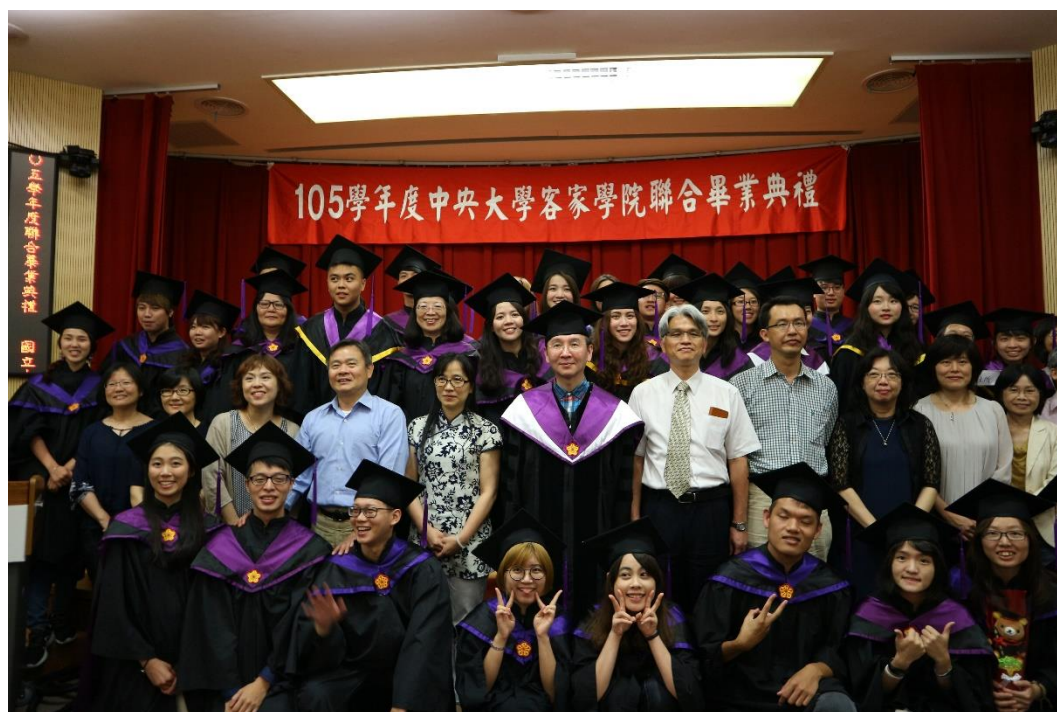
(客家系三所碩士班畢業生與師長們合影。)

中央大學畢業典禮於6月3日舉行，在早上全校假依仁堂舉行的畢典結束後，下午1點30分於客家學院舉行碩博士生、在職專班、法政所及首屆大學部的聯合畢業典禮。在典禮中，各所主任、老師們對於畢業生許多勉勵的話，不僅是鼓勵、也是對於畢業生的期許，對我來說，更是珍貴的紀念，也是日後的鼓勵與回憶。