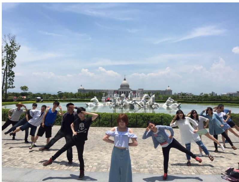
(同學們才華洋溢，各有所長，希望以後能成為一生的好朋友)

會是一件很棒的事。我想，要找到屬於自己無與倫比的美麗，要成為別人無與倫比的美麗(就像我一樣 XD(笑))，也是一件很棒卻也很難、可遇而不可求的事。」