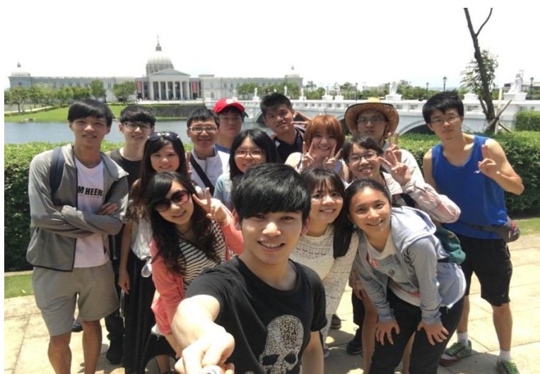
(一起辦活動培養革命情感，同窗情誼長存我心中)

新的旅程即將開始、舊的成為過去與回憶，回顧了兩年的活動，從碩一的研討會之旅、再到客家青年世界咖啡館、行前在渴望園區場堪、確認活動流程、面對有限的時間與經費，還有跨年前的報帳驚魂(阿阿尖叫， deadline 要到了，甚麼時候可以送審)、以及跨年夜當日朋友家頂樓放鞭炮，結果被風吹倒，朝向我們發射而驚嚇逃竄的場面；台南三天兩夜的旅行，去神農街、台南四草(應該是台江國家公園)、林百貨、水晶教堂、奇美博物館，還有溫馨的送舊、耶誕 party，這些與各位的回憶與承載，成了影片中一一放映的影像；甚至是回憶錄，很開心認識各位及與你們一同行動的日子。