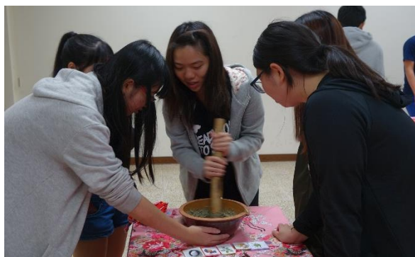
【活動參與者正努力的磨播茶】

活動的一開始，由主持人進行開場，接著以小組為單位進行遊戲，勝利者可先選想要的粿粿口味，接著到客家學院迴廊進行闖關遊戲。每個遊戲的關主都有屬於自己的角色，皆與客家飲食或文化有關，如白斬雞、新丁粿、膨風茶、藍染、油紙傘等。在進行遊戲前，關主們會進行一段解說，讓參與者在遊戲當中，獲得