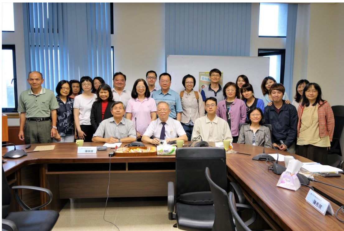
【畚客關係研究工作坊論文發表會圓滿結束，全體合影留念】

最後，羅教授感謝董教授費心的對每篇文章給予指教。至此，此次的「畚客關係研究工作坊」圓滿落幕。