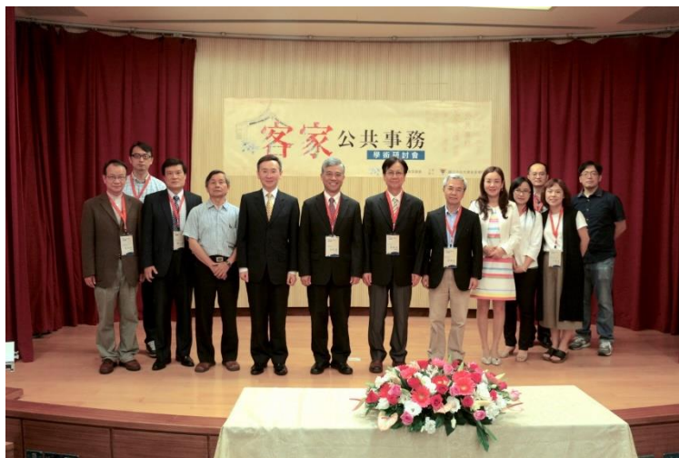
【客家學院於 5 月 20 日舉辦客家公共事務學術研討會，展現客家公共事務議題的多元性及重要性】

國立中央大學客家學院於本（5）月 13 日至 20 日舉辦為期一週的「2017 客週求見——夏客藝起趣」系列活動，為展現客家學院在客家公共事務議題上豐碩的教研成果，特別於 5 月 20 日假本院國際會議廳舉辦「客家公共事務學術研討會」。開幕式邀請客家委員會范佐銘副主委及國立中央大學劉振榮副校長擔任致詞嘉賓，並由國立交通大學客家文化學院張維安院長、國立中央大學法律與政府研究所鍾國允教授及元智大學社會暨政策科學學系劉阿榮教授擔任各場次主持人。