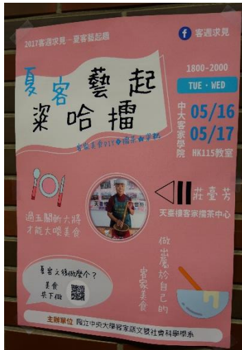
【夏客藝起粿哈播－客家粿粿播茶 DIY 宣傳海報】

今年五月的客家週主題為「夏客藝起趣」，推出七大夏日系列活動，包含學術、文化、藝術類別，豐富又多元，其中「夏客藝起粿哈播－客家粿粿播茶 DIY」邀請對客家文化有興趣者體驗客家傳統鹹播茶以及特殊口味的粿粿製作，以闖關遊戲的型式獲得 DIY 所需食材，好吃、能學習又好玩。