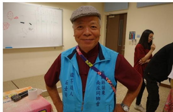
圖／夏客藝起粿哈播工作人員攝影】