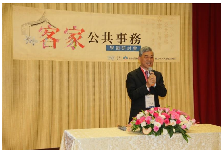
【客委會副主委范佐銘期許研討會的豐碩成果能成為客委會政策推動的後盾及助力】

客委會副主委范佐銘表示，客家公共事務的推動除了政府之外，更需要民間及學術單位來共同配合，相信今天的研討會對客家公共事務的推動有很大的幫助。范副主委也提到，《客家基本法》修正之後，希望能逐漸提升客語的重要性，成為國家語言之一，為了推廣更多客家語言、文化及公共事務，將於今年六月份推出全國性的客家廣播電台名為「講客電台」，除了將線上播出外，將特別為年輕人設計許多有趣的節目。副主委最後期許本次研討會的豐碩成果能成為客委會未來政策推動的後盾及助力，並祝福本次研討會順利、中央大學校運昌隆。