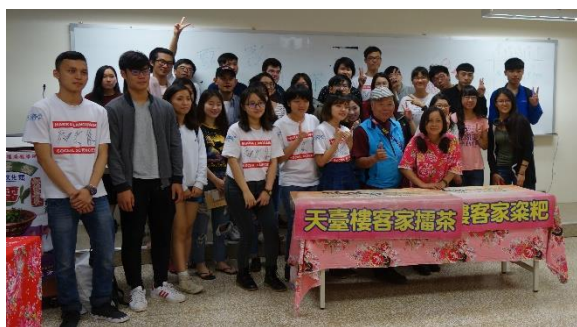
【全體人員大合影 圖／夏客藝起粿哈播工作人員攝影】

此次【夏客藝起粿哈播－客家粿粿播茶 DIY】活動，結合了吃、玩以及客家文化的學習，讓客家學院充滿歡笑聲，也為中央大學客家週一系列活動增添美麗色彩。