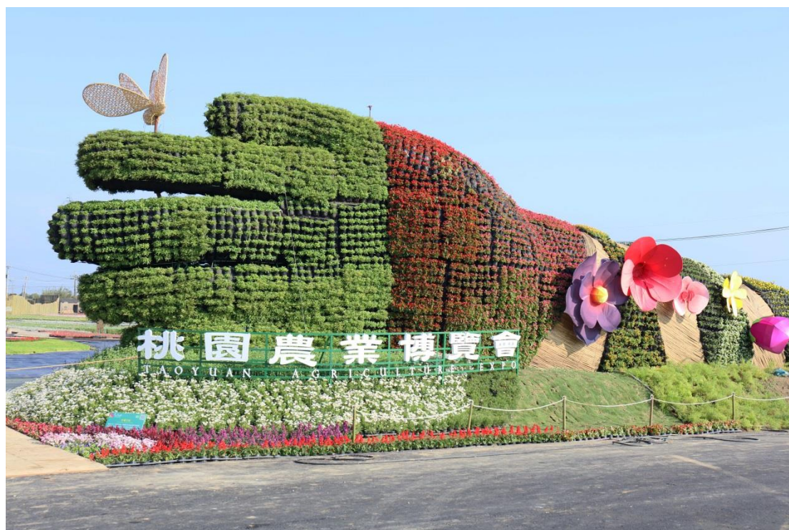
【圖／桃園農業博覽會官方網站；設計/江元皓】

2017 桃園農業博覽會在新屋，於 4 月 22 日登場，整個園區超過三十公頃，共規畫成八大展區供民眾參觀，園區內每日皆有安排展覽和動態秀、水舞秀的演出，假日更規畫了一系列的活動，如音樂會、市集、劇團演出等與民同樂，希望藉由這些展覽和活動讓大家看見在地農業的特色、多元文化融合、未來農業科技的可能和桃園特有農業實力的展現。