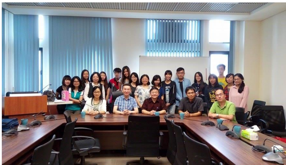
客家學院與拉曼大學座談會後師生合影。