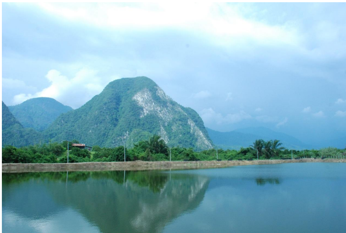
【圖 / 石山脚錫礦湖 / 臺灣聯合大學系統馬來西亞國際志工團】