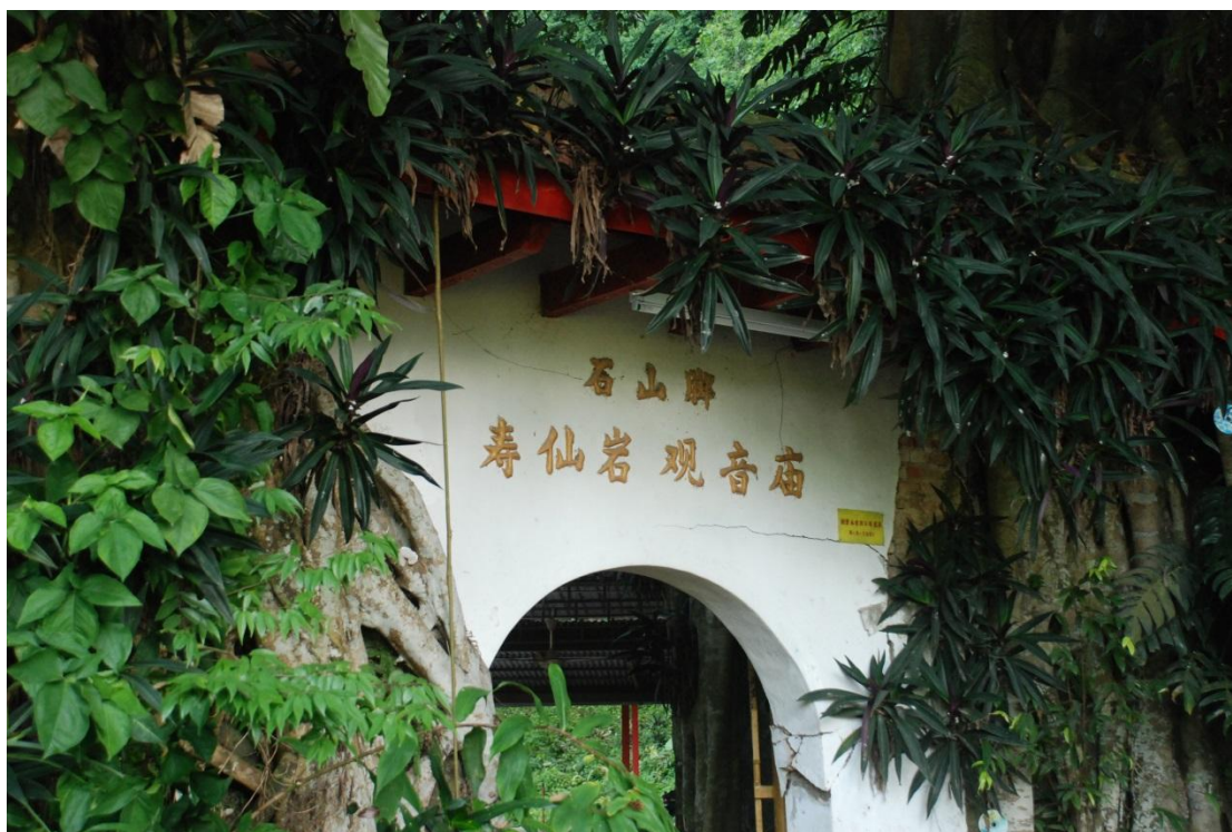
【圖 / 石山脚壽仙岩觀音廟 / 臺灣聯合大學系統馬來西亞國際志工團】