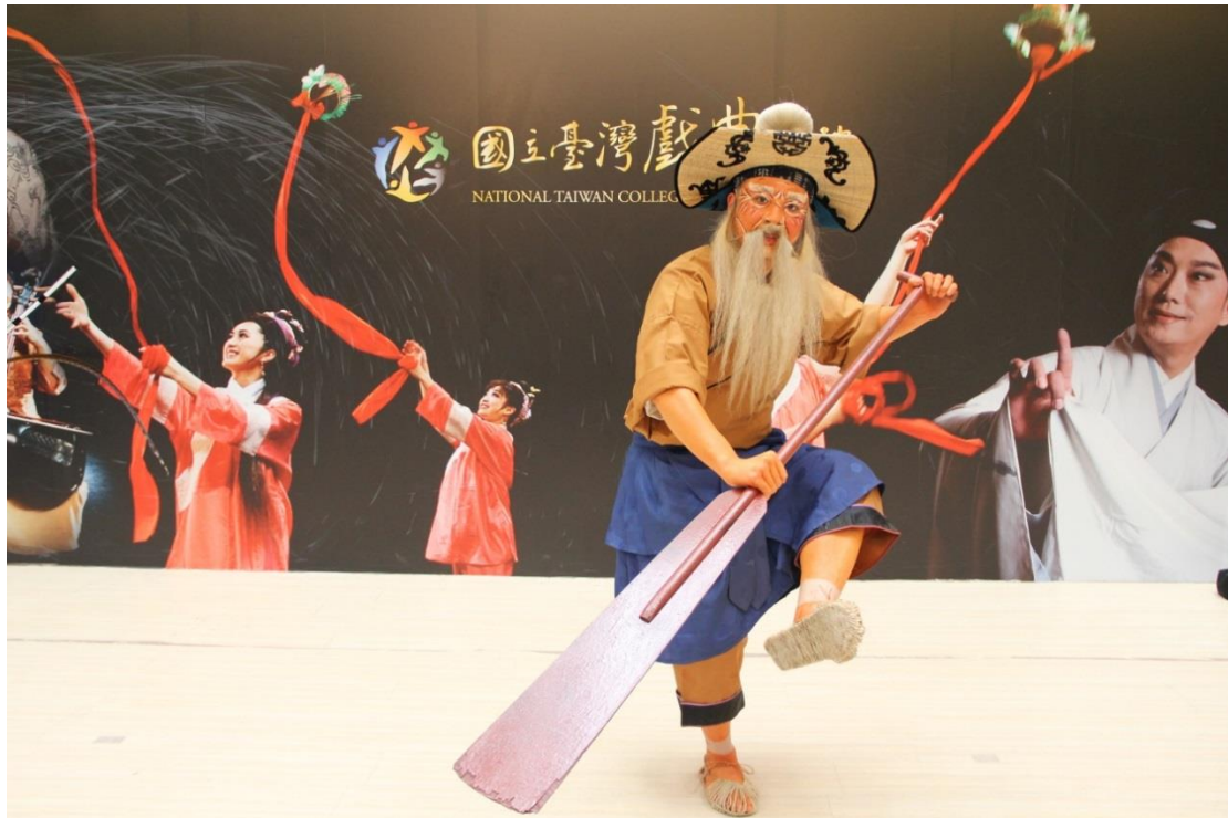
《秋江》艄翁