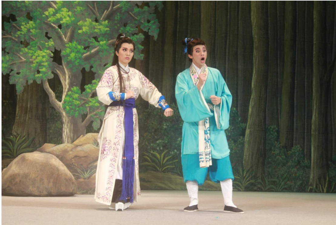
《高風豹下山》(2015)