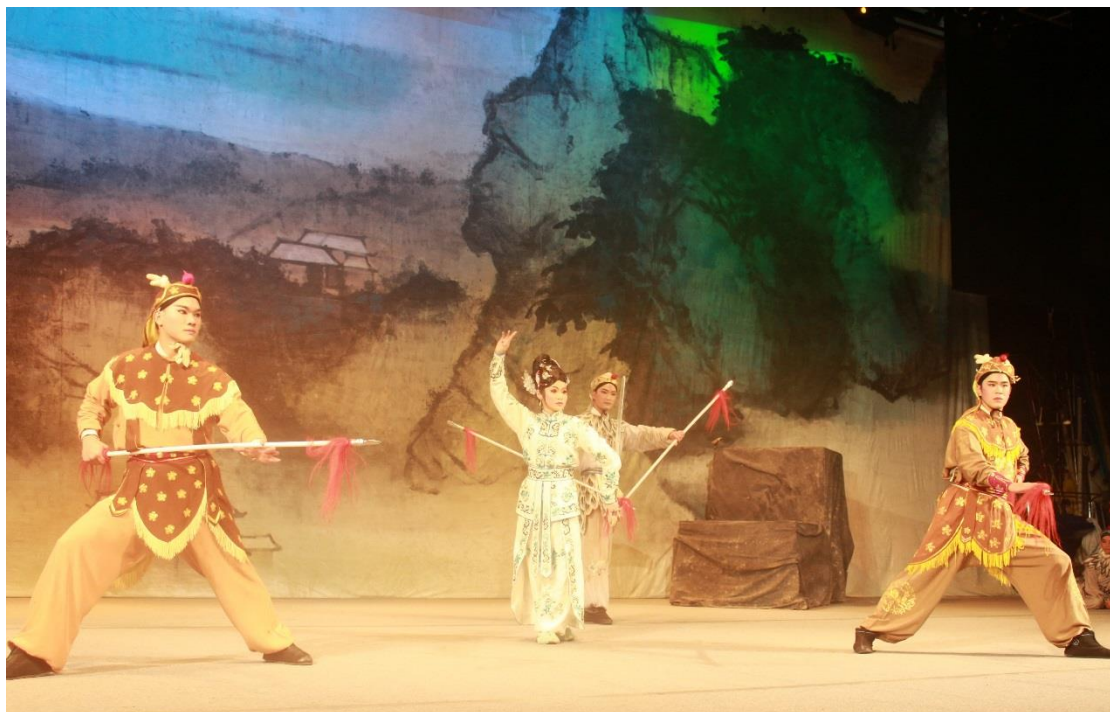
《仙山尋藥》(2015)