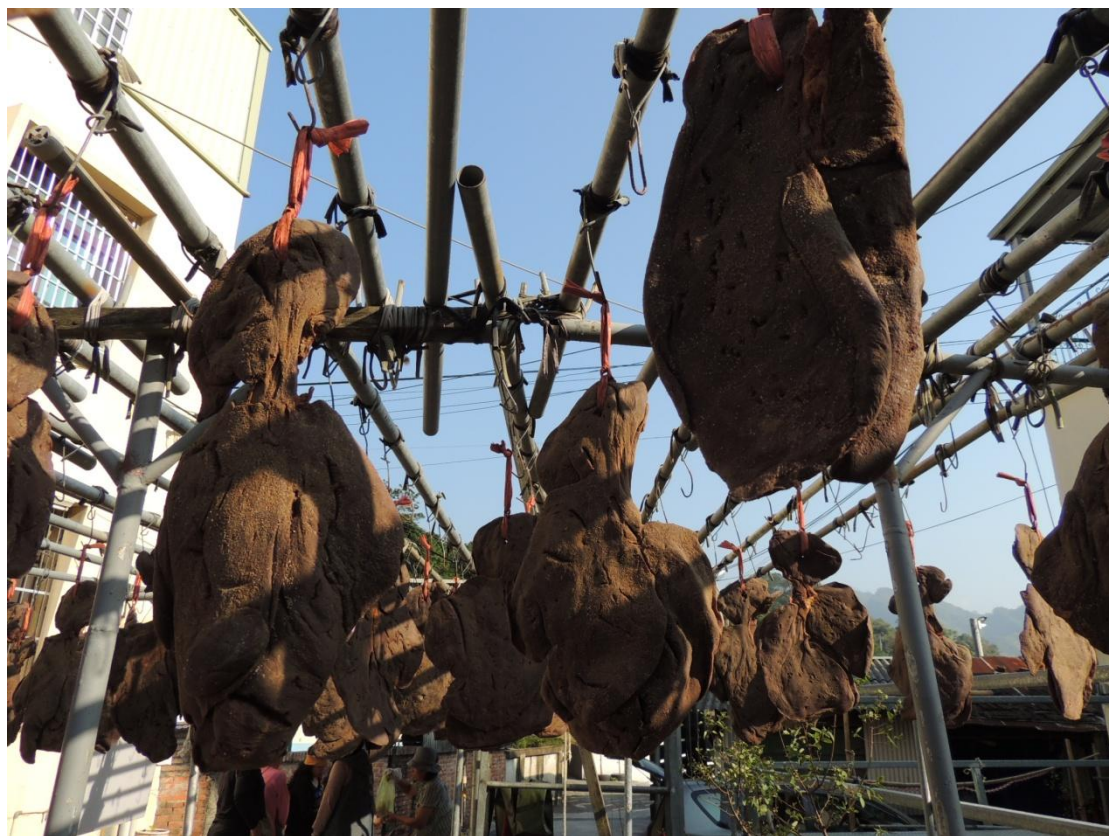
苗栗縣汶水老街 攝於 2013 年 11 月 17 日

在這裡你可以感受到客家人的風土民情，而重新整理過的老街、木製的招牌、紅磚地，讀讀關於汶水的歷史，過往繁華盛況不難想像。即使是在假日人潮也不多，有別於其他的老街人滿為患、商家林立的情景，挺適合在假日走走。這裡離大湖也很近，下次來苗栗採草莓時，別忘了可來汶水老街走走，與「肝膽」相照一下並體驗道地客家風情。