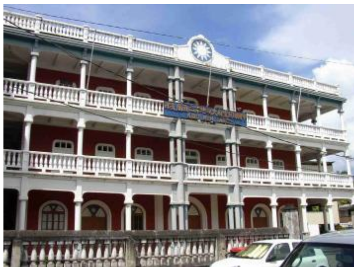
中國國民黨駐大溪地第二支部

1911 年，孫中山先生領導革命，建立中華民國，先前在海外成立的興中會、同盟會，其成員多數是廣東客家人。這些移民大溪地的客家人，就像移居東南亞的華僑一樣，幾乎都心向祖國，支持革命。雖然遠在異地，且歷經百餘年，但仍持續支持中國國民黨支部，並以黨徽作為精神寄託。趙少康先生發現後，形容真是國民黨黨史的一大奇跡，真有「禮失求諸野」之慨。