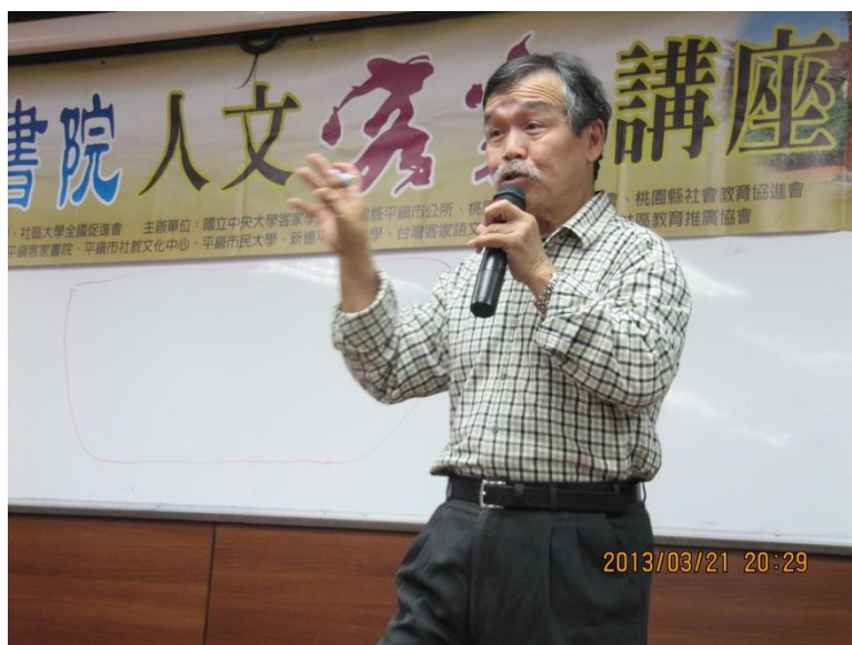
(許宏勛攝於 2013 年 3 月 21 日)