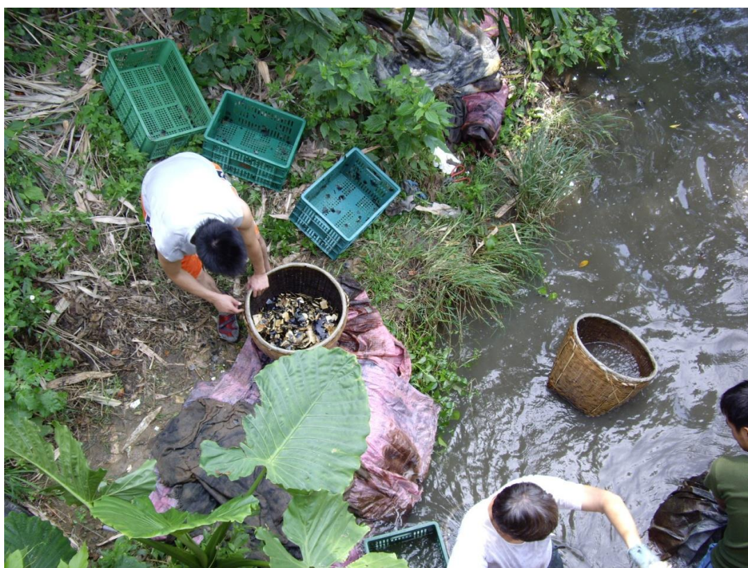
早期在河裡洗滌藥材