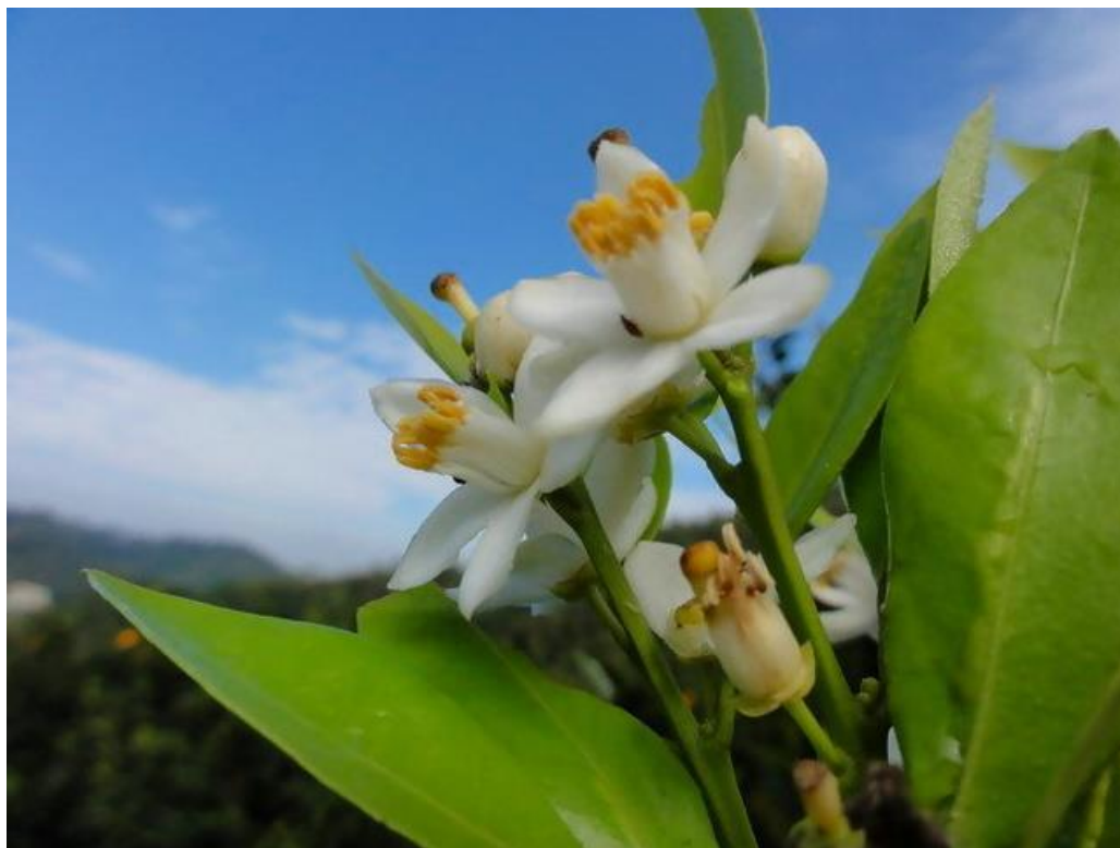
(阿光家个柑仔花)