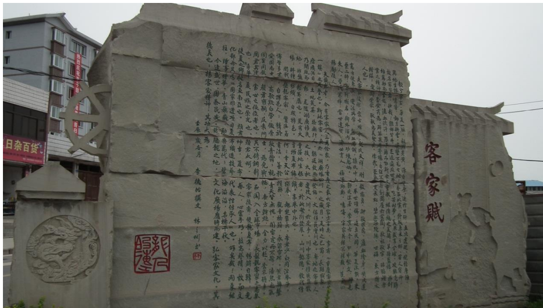
重慶市榮昌縣 2012 年 3 月設立「客家文化廣場」及其「客家賦」刻石。