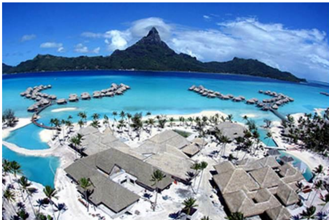
大溪地的旅遊天堂-Bora Bora 島 (取材自網路 http://www.sintu.com/mudidi/daxidi/19-8396.html )