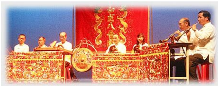
和成八音團

將北管的唱詞投影在布幕上，讓台下觀眾更了解唱詞的意義。此次的表演有別於後台的自由輕鬆，團員個個都非常緊張，最終不負眾望，憑著團員多年的經驗成功演出。