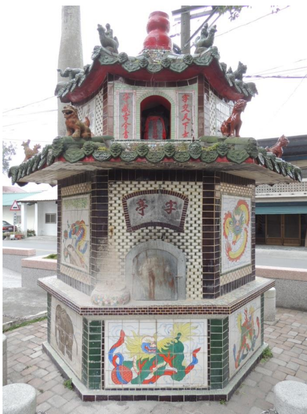
圖為台東縣池上鄉玉清宮內的惜字亭 攝於 2014.1.26

玉清宮創建於民國三十七年，惜字亭則建於民國六十年。惜字亭係六角形磚造三層結構，其第二層為焚化字紙之處，爐口上題「字亭」二字，其上層供奉魁斗星君神位，兩邊有：「字交天下士，亭藏古今書」之對聯。頂端有泥塑葫蘆代表能達天庭，二、三層琉璃瓦上有吉祥之物，本惜字亭為東部目前僅存，已歷四十寒暑。有些人說惜字亭是客家人特有的，其實福佬族群亦有惜字亭(譬如桃園蘆竹五福宮)，只能說目前台灣僅剩的惜字亭大多在客家地區且保存完整，面對惜字亭遙想古人對於文字與知識的重視，這樣的態度是我們後人應學習及維持的。