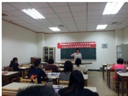
桃園縣政府中高級認證班-四縣班

桃園縣政府客家事務局對客語復甦及傳承工作之推動不遺餘力，持續鼓勵學生與公務人員學習客語，廣開設客語認證研習班，提升取得客語認證人數，101 年共開設 43 班公務客語研習班，另補助薪傳師增開 51 班傳習課程。新的一年亦規劃開辦至少 50 班公務客語研習班，及鼓勵薪傳師增開 80 班以上傳習課程，希望藉此提升參加客語認證與合格人數。