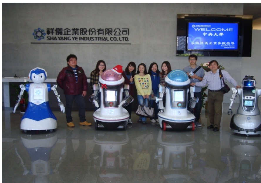
(攝於 2012 年 12 月 14 日)

接著，我們到桃園的祥儀機器人夢工廠，屬於觀光工廠的形式，夢工廠共分五大區域：分別為產品區、再生能源利用區、家庭智能化專區、互動體驗區以及機器人演進史。相較於木雕博物館，我們在機器人夢工廠看到產學的結合。除了看到許多高科技的產品，在再生能源利用區是利用工廠廢棄物重新創造機器人藝術品，廢棄金屬在藝術家的巧思下重新賦予新生命，此外，在互動體驗區能讓參觀者實際操作機器人及相關產品互動，包含現場架設的大型夾娃娃機台，刺激對打的格鬥機器人、越野機器人等，同學們和老師更是玩的不亦樂乎。我們在參觀的導覽過程中，機器人配合著真人為我們做導覽的，過程相當有趣，機器人靈活的扭動關節跳舞，舞台區的精采表演帶給您不同以往的視覺震撼!