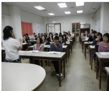
桃園縣政府基礎班第二期