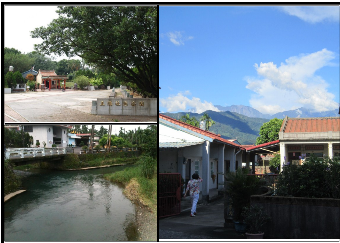
【攝於 2012 年 7 月 1 日及 10 月 30 日】

五溝水是個位於萬巒鄉中部的客家小村落，內有東興、西盛、大林、得勝四庄，同時與閩南、平埔族群相鄰而居，因此自拓墾以來便紛爭不斷。幸而五溝水正如其名，受五條溝渠環繞及貫串，形成了天然防衛界線。五溝水是台灣西部第一個被登錄為「文化資產保存聚落」的村莊，只因她擁有整體保存完善的客家伙房群，以及獨特的水流景觀「三河水」和「水流東」，此兩種景觀在堪輿家的眼中都是極為靈秀的風水地形。一進到五溝水，便會不自覺的放慢腳步，這裡的村民喜歡在門前放張桌子和幾張椅子，偶爾純聊天偶爾泡壺茶，一坐就是一個早上或一個下午，再慢悠悠的走回家準備中餐或晚餐。五溝水，一個沒有熱鬧的市集也沒有高級的餐廳的小村莊，卻有著最質樸的客庄風味。