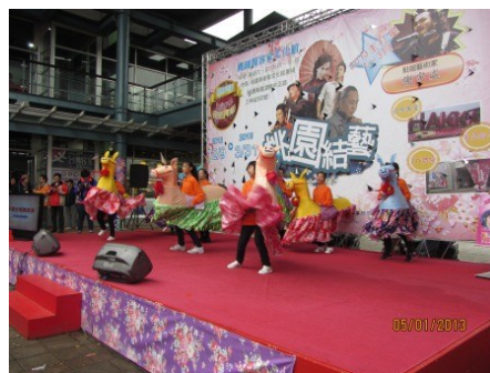
社區展現布馬舞成果