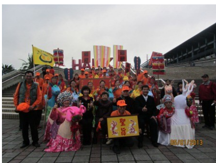
平鎮東勢建安里布馬舞全體合照

獲得平鎮踩街優勝的建安社區布馬隊，是繼中平國小布馬隊、過嶺社區發展協會布馬隊後，桃園地區第三個布馬表演團隊，近一個月努力排演新作「狀元遊街迎金蛇 國泰民安慶豐收」，表演首先是客家正統布馬狀元遊街迎金蛇(年)，接著是由幾近失傳非物質文化重現的古代春秋戰國時期的兵法戰陣流傳在民間的布馬民俗廟會套路表演，最後是具台灣客家意象強烈的快板客家本色串連桃園推廣的瘦瘦拳和世界流行時尚的韓國騎馬舞表演，在全場振奮人心的鑼鼓樂下，敘述金蛇(年)國泰民安慶豐收，現場精彩壯觀的演出，獲得民眾滿堂彩。