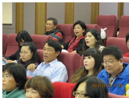
學員認真練習發音