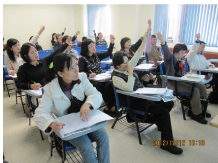
學員踴躍參與學習