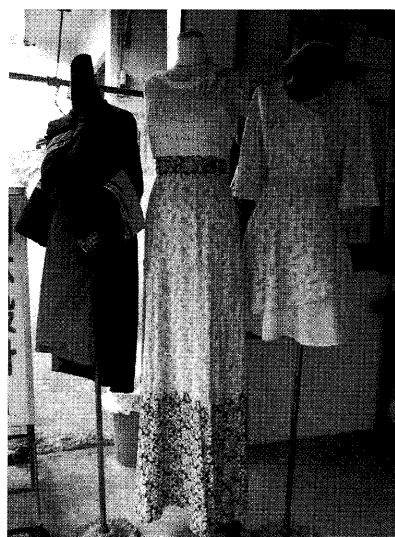
圖4 客家桐花衣(右邊兩件)