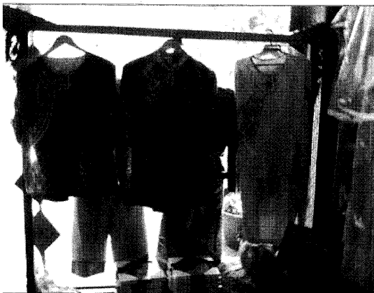
圖 1 屏東客家服飾業者改良的藍衫

概念卻是類似的，她們多傾向沿用傳統服飾外觀上最突出的設計重點來「延續傳統」，改良以不改變傳統服飾的基本結構為原則，所以這些改良，往往都還能讓人「看得出傳統」，而常被客家相關團體挑選為營造客家形象的制服或團服，廣泛地穿用於各種需要強調「我是客家」的情境。