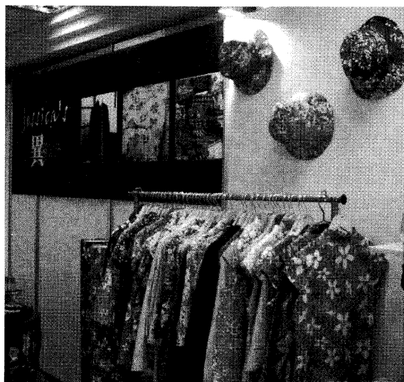
圖3 以「客家花布」製成的衣服和帽子

不論是花布衣(圖3)還是桐花衣(圖4),都不強調特定的形制結構,反倒是為了開發「客家花布」更多的可能性,在形制上鼓勵多加創新。因此這類服飾款式十分多元,除了是以特定幾款花色的「客家花布」為材質之共同特徵外,形制有中式,也有西式;風格可以很復古,也可以很現代。無須受限於傳統服飾形式風格的承襲,就能因布料本身所具備的客家象徵性,而獲得「客家居飾」之名。只不過相對於大襟衫類服飾,花布衣和桐花衣,往往被當成一種「創新」。