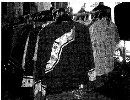
圖 2 苗栗客家服飾業者改良的客家服